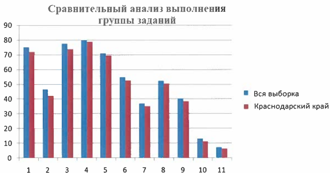
Рис.2 Сравнительный анализ выполнения группы заданий среднероссийских результатов и Краснодарского края

На рисунке 2, приведены сравнение результатов выполнения обучающимися 7 классов отдельных заданий всероссийской проверочной работы по физике среднероссийских и Краснодарского края.