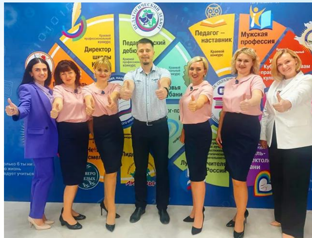
«Четверо смелых» Призеры краевого конкурса учительских команд