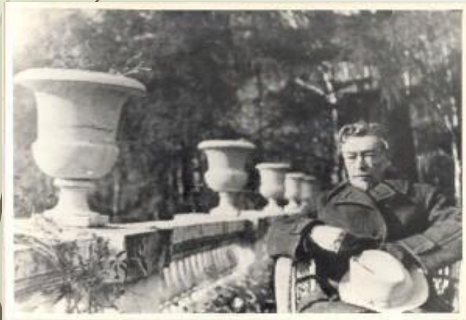
В.Я. Шишков в санатории "Архангельское" (1943 г.)

Итогом нескольких лет работы на Алтае дорожным инженером стал сборник путевых очерков «По Чуйскому тракту» и рассказов «Чуйские были». С 1927 года Шишков жил в Детском Селе. В 1928—1930 годах писатель работает над повестью «Странники» о беспризорниках. Был участником поездки группы писателей и журналистов на строительство Беломорканала. Последние семь лет жизни работал над задуманной им трёхтомной исторической эпопеей «Емельян Пугачёв».