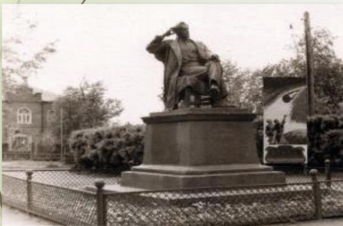
Памятник В.Я Шишкову, Бежецк, городской парк

За первые же полтора года пребывания в Москве Шишков написал четырнадцать рассказов, вышедших затем отдельной книгой «Гордая фамилия». В октябре 1943 года за выдающиеся заслуги в области литературы, в связи с 70-летием со дня рождения В. Я. Шишков был награжден орденом Ленина.