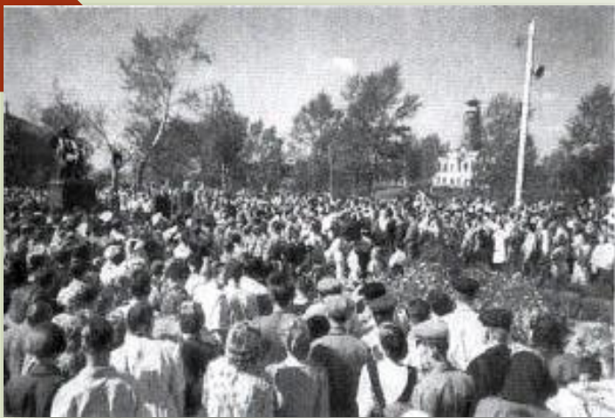
Открытие памятника писателю-земляку В.Я. Шишкову. 20 августа 1950г. Скульптор И. Рабинович