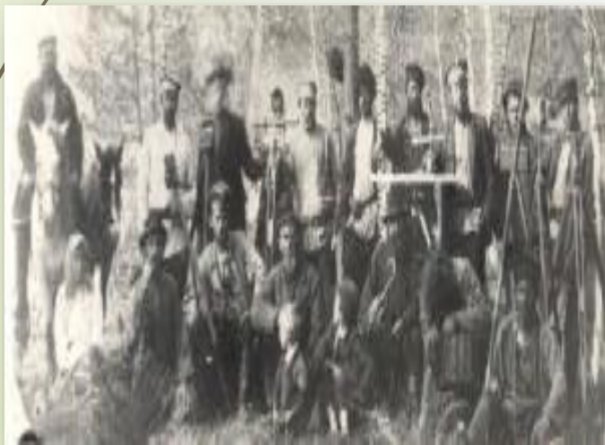
В.Я. Шишков (стоит 3-ий справа) во главе экспедиции на р. Бии в 1910 г.. Изыскательская партия на привале.