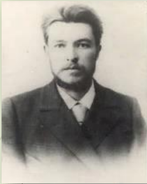
В.Я. Шишков. Томск, 1900 г.