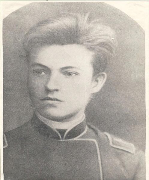
В. Шишков - ученик Вышневолоцкого технического училища (1891 г.)

Вячеслав Яковлевич Шишков родился 3 октября 1873 года в г. Бежецке, Тверской губернии, на Воздвиженской улице (ныне улица Шишкова), где и провел свои детские и юношеские годы. Здесь он прожил первые двадцать лет своей жизни, сюда много раз приезжал он и вышневолоцким студентом, и сибирским инженером, и известным всей стране писателем. Тверские места изображены в ряде его произведений.