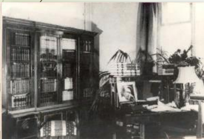
Кабинет В.Я. Шишкова (Москва, ул. Горького, дом 8)

После переезда в Петроград, Сибирь и особенно Алтай остаются одной из основных тем его творчества. Вершиной сибирской прозы Шишкова стали романы «Ватага» 1923 год и «Угрюм-река» 1932 год.