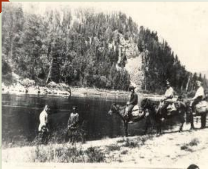
Экспедиция на Алтае (река Бия, 1910 г.)