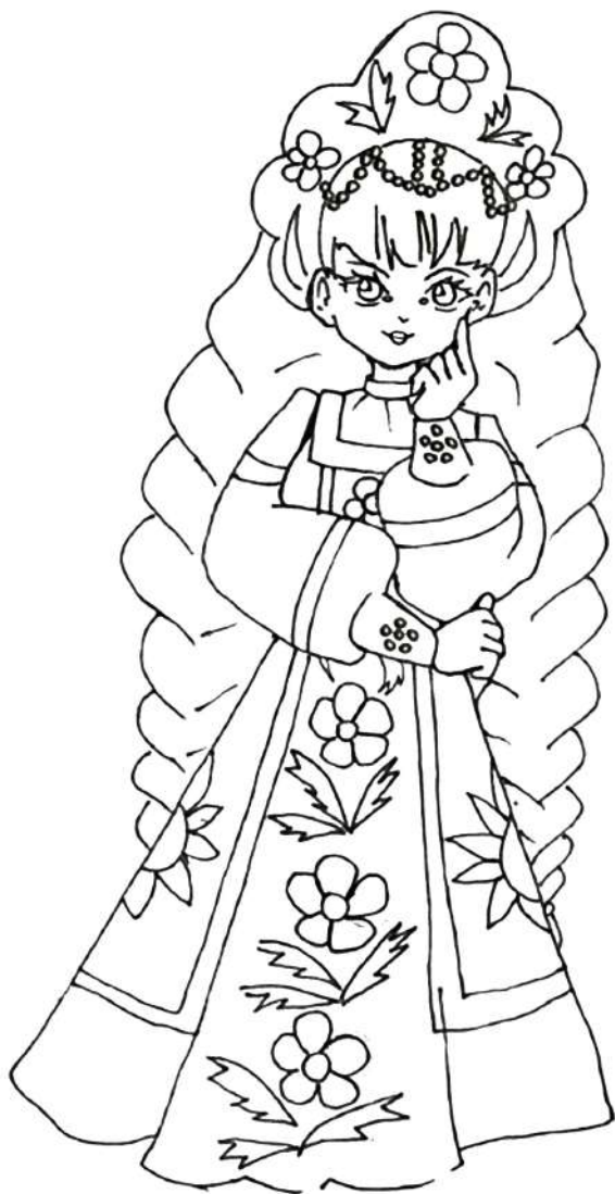
Главные символы костюма: sarafan, рубаха и кокошник