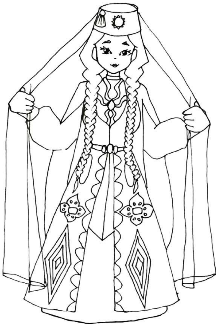
Главные символы костюма: халат, тюбетейка, платок