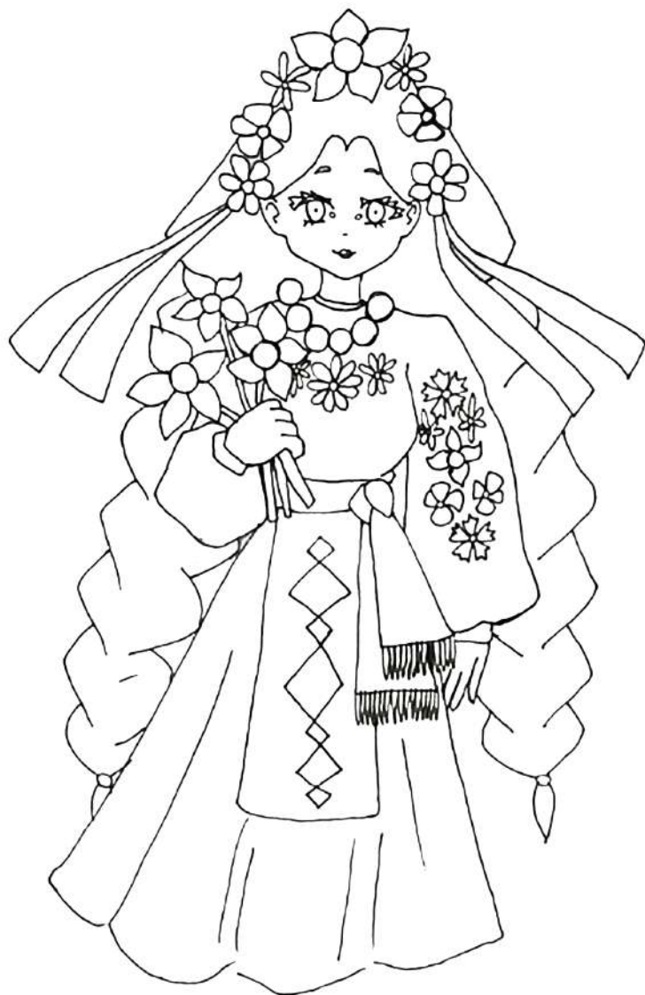
Главные символы костюма: рубашка-вышиванка, юбка с передником, пояс, венок с лентами