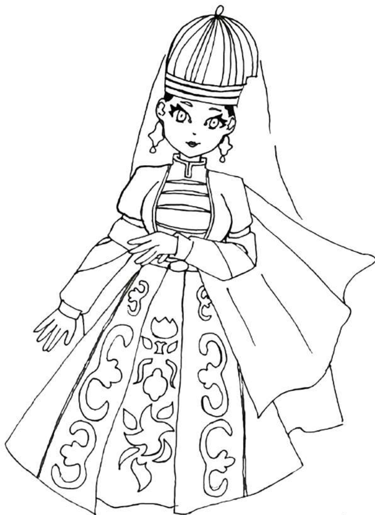
Главные символы костюма: кафтанчик, шапочка, шарф, пояс.