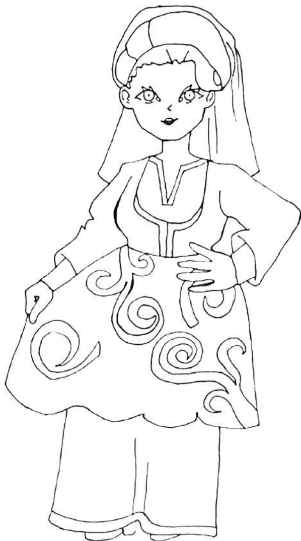
Главные символы костюма: Нижнее платье, рубашка, передник, жакет