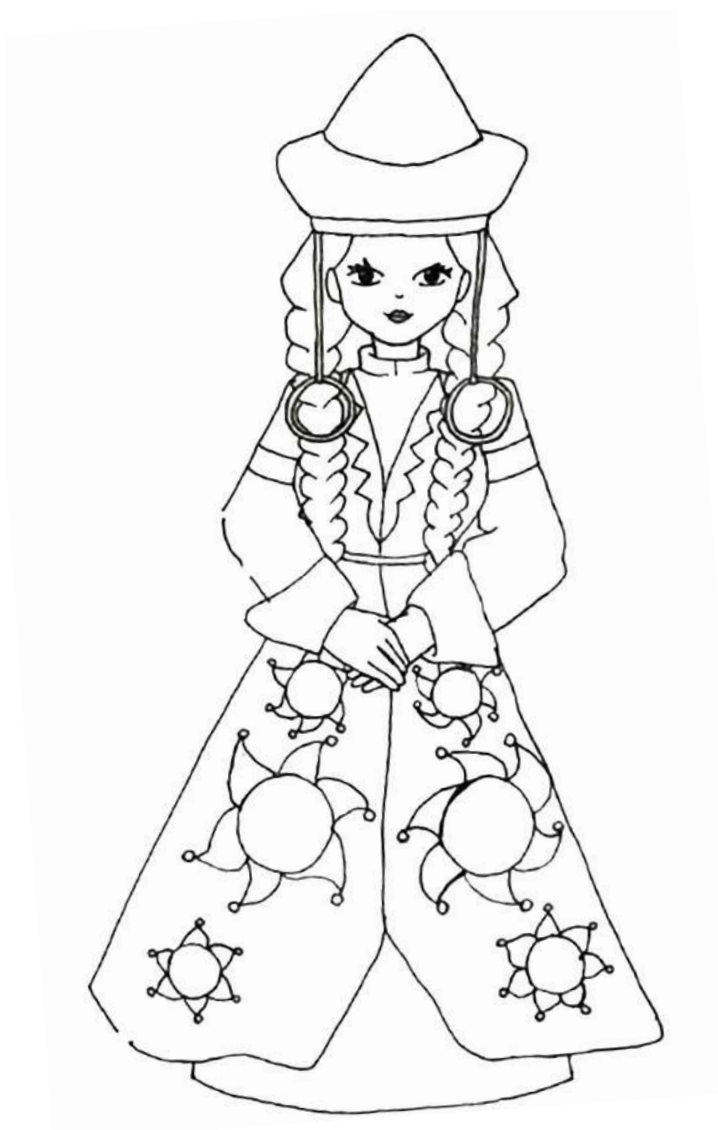
Главные символы костюма: рубаха, штаны, поверх которых носили халат.