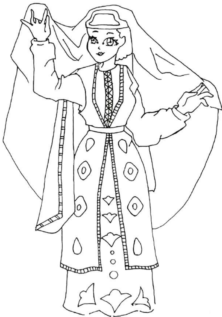
Главные символы костюма: платье, кафтан, пояс, шапочка с платком