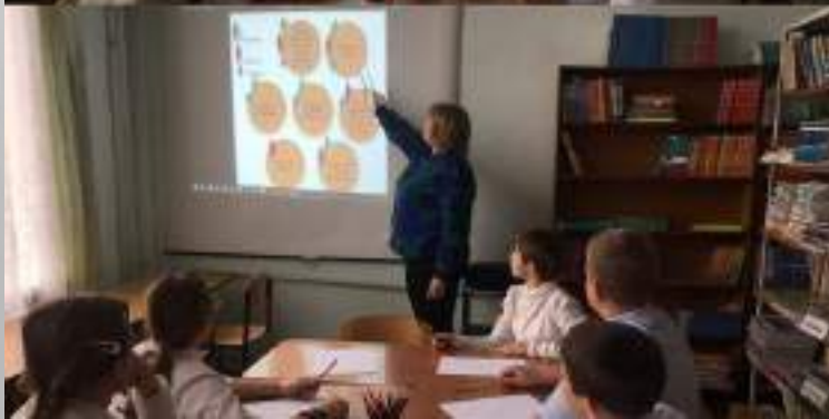
Занятие с группой детей «Хочу,могу,надо»