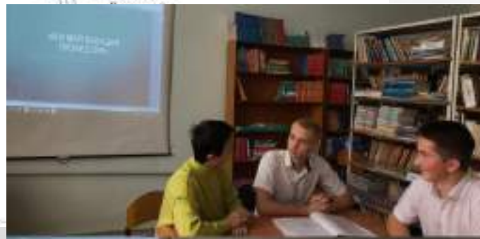
Я и моя будущая профессия