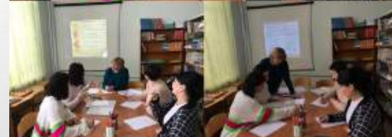
Круглый стол с классными руководителями «Правила эффективного взаимодействия с родителями»