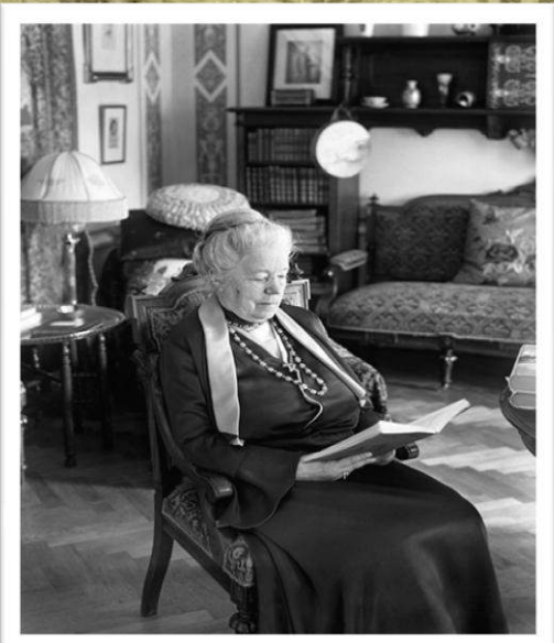
Сельма Лагерлёф читает