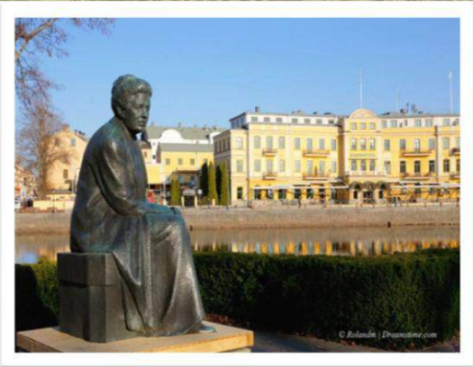
Памятник С. Лагерлёф в Карлстаде, Швеция.