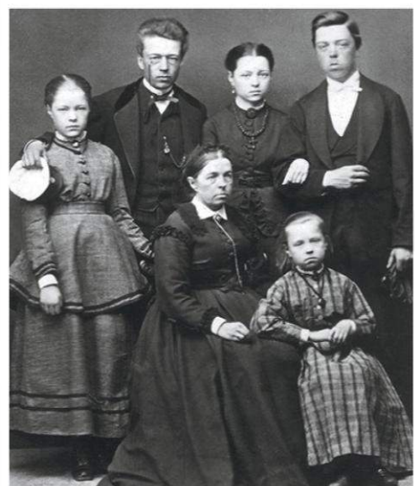
Сельма с матерью, братьями и сёстрами 1872 г.