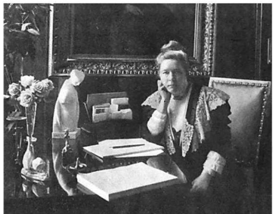
Сельма Лагерлёф в молодости.

Чтобы получить образование она поступила в учительскую семинарию в Стокгольме и окончив её, писательница поступила в Королевскую высшую женскую педагогическую академию, которую закончила в 1882 г. В том же году умер ее отец, и родовое имение Морбакка было продано за долги. Эта двойная потеря, отца и семейного дома, была для девушки тяжелым ударом.