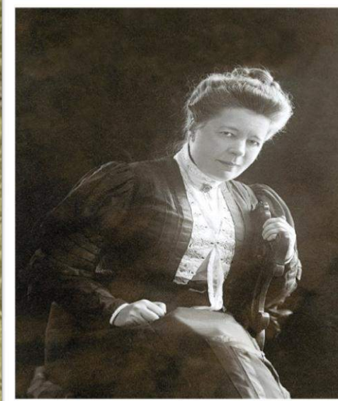
Сельма Лагерлёф в молодости