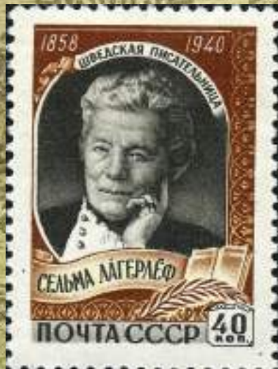
В 1959 году в СССР вышла в обращение почтовая марка, посвящённая Лагерлёф.

Швеция гордится своей великой писательницей и много делает для сохранения памяти о ней. Через несколько лет после смерти писательницы ее дом открыли для посетителей. Поток туристов в знаменитое поместье не иссяк и по сей день, хотя путь сюда не является самым простым. Даже спустя многие десятилетия чудесные книги Сельмы Лагерлёф с удовольствием читают дети и перечитывают взрослые, они переведены на 60 языков и продолжают издаваться во всем мире.