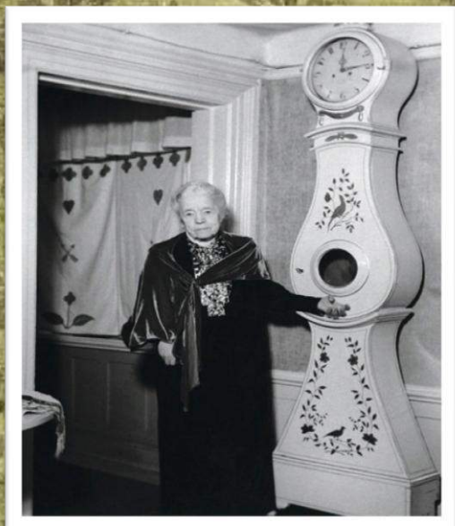
Нобелевский лауреат Сельма Лагерлёф.