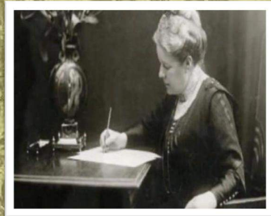
Сельма Лагерлёф за работой.

После выделения писательницы королевской стипендии, она полностью посвятила себя литературной работе и перестала преподавать. В печати регулярно стали выходить её рассказы, а примерно раз в год - повесть. Писательница много путешествовала: Италия, Палестина, Египет. Вернувшись в Швецию Сельма Лагерлёф опубликовала исторический роман «Иерусалим». После публикации романа она становится известной в Европе.