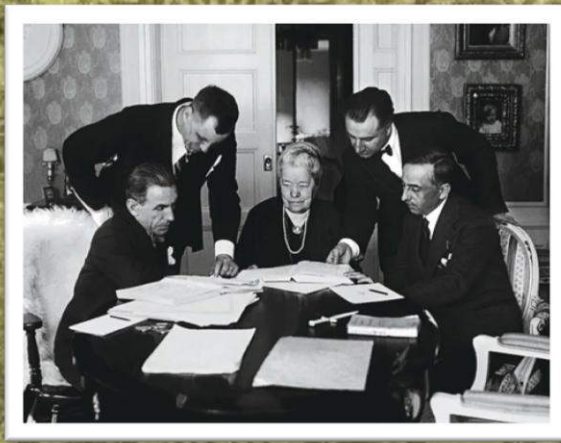
Сельма с другими номинантами: Теодор Кохер, Вильгельм Оствальд, Фердинанд Браун, Гульельмо Маркони.

Писательницу избирают почётным доктором Упсальского университета, а в 1909 году Лагерлёф была присуждена Нобелевская премия по литературе. Она стала первой и пока единственной в истории культуры писательницей, получившей столь высокую награду за произведения, написанные для детей. На церемонии вручения, проходившей в Королевской музыкальной академии рядом с ней стояли другие номинанты: Теодор Кохер, Вильгельм Оствальд, Фердинанд Браун, Гульельмо Маркони.