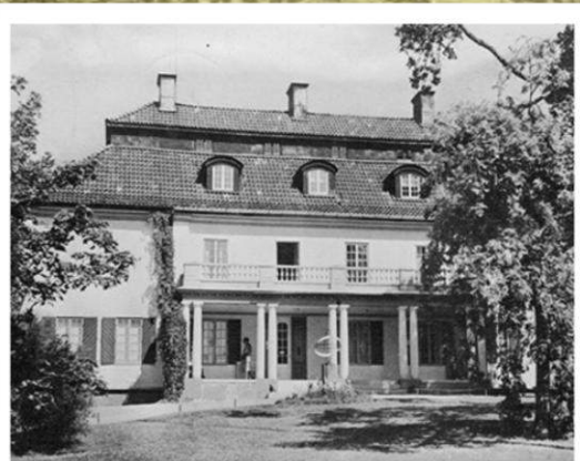
Усадьба Морбакка, Швеция.