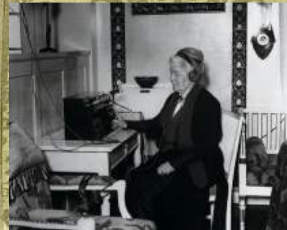
Сельма Лагерлёф слушает радио.

Сельма умерла 16 марта 1940 года в своем родовом поместье Морбакка. Любимой миллионами шведской писательнице был 81 год.