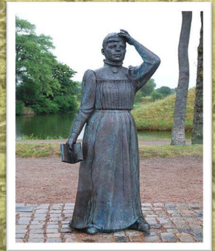
Памятник С. Лагерлёф в городе Ланскруне. Установлен в 2009 году. Автор — Йонас Хёгстрём.

В городах Ландскрун и Фалун установлены памятники Сельме Лагерлёф, а в Стокгольме, Карлскруне, Скурпе и Мальмё — памятники Нильсу Хольгерсону. А в 1985 году именем выдающейся шведской писательницы назвали кратер на Венере. Список экранизаций произведений Лагерлёф включает 39 наименований. В 2008 году биографию писательницы экранизировали – вышел шведский сериал «Selma».