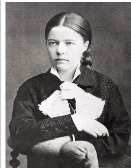
Сельма Лагерлёф 1881 г.