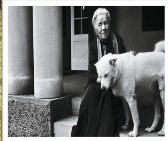
Сельма Лагерлёф с домашним питомцем