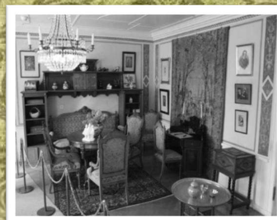
Комната в усадьбе Морбакка