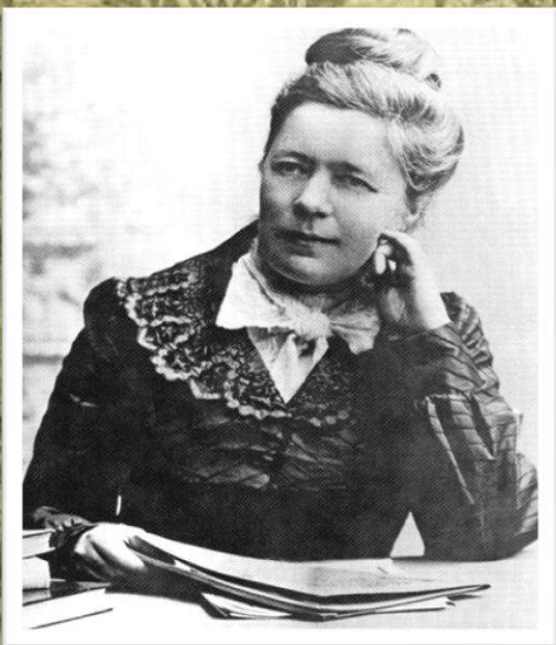
Сельма Лагерлёф – учительница в школе.