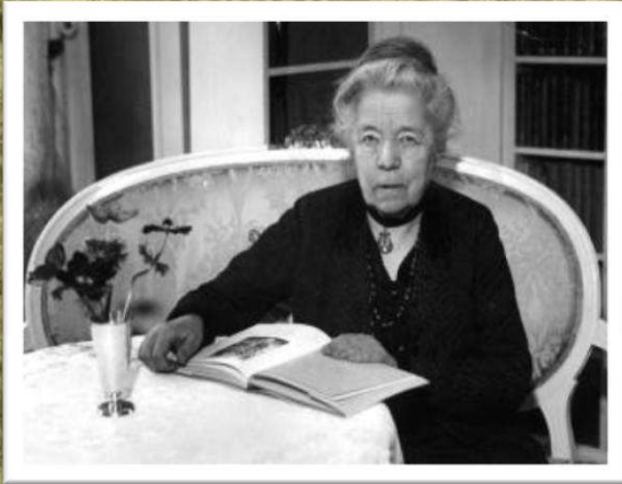
Сельма Лагерлёф дома.