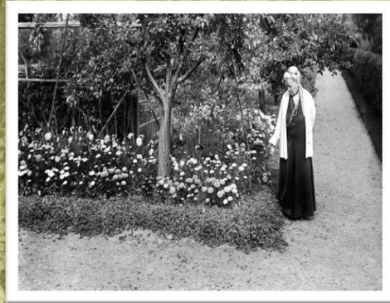
Сельма Лагерлёф на прогулке.

Первый том своей книги «Чудесное путешествие Нильса Хольгерсона по Швеции с дикими гусями» по задумке Лагерлеф должно было стать хрестоматийной книгой для первоклашек, изучающих географию. Конкурс она выиграла и написала второй том хрестоматии. Так появился самый известный персонаж писательницы – это Нильс Хольгерсон. Произведения о нем были изданы на шестидесяти языках и завоевали популярность среди юных читателей по всему миру. В 1907 году вышла новая книга писательницы, а именно повесть «Девочка с фермы на болотах». Чуть позже выйдет сборник новелл «Гномы и люди».