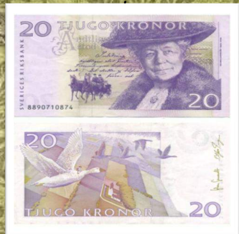
В 1991–2015 годах на купюре в 20 шведских крон был изображён портрет писательницы.