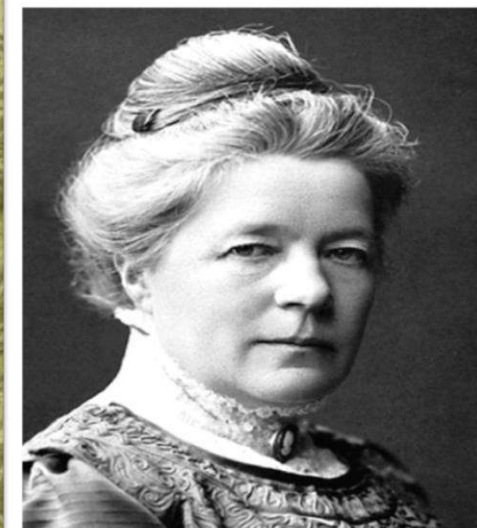
Сельма Лагерлёф 1909 г.