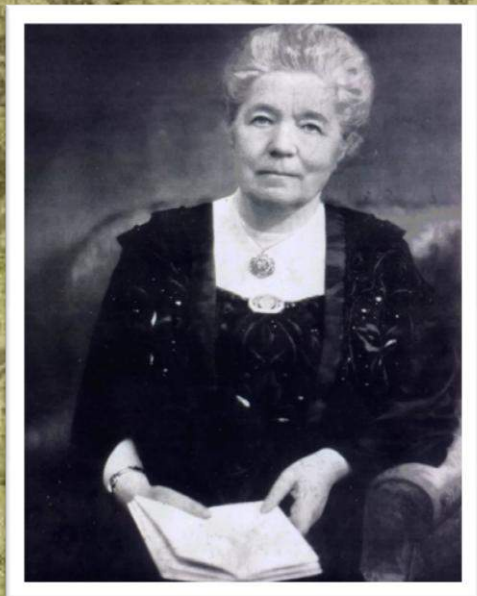
Сельма Лагерлёф позирует.