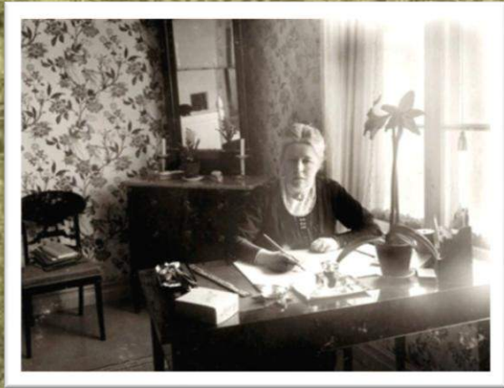
Сельма Лагерлёф в творческом процессе.

Вскоре Сельма получила место преподавателя в женской школе в Ландскруне на юге Швеции, где она быстро завоевала любовь и популярность у своих учениц.