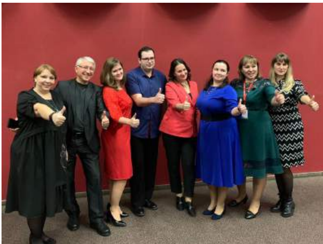
Участники номинации «Естественно-научная»