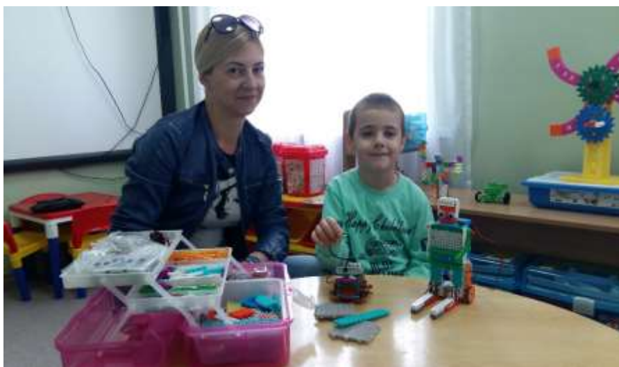
Фото 1. Мероприятие с детьми и родителями «Путешествие в страну HUNAROBO» с использованием робототехнических конструкторов для детей старшего дошкольного возраста.

В рамках семейного клуба «Robofamily», родители на очных встречах познакомились с робототехническими конструкторами и их техническими характеристиками, конструируя модели освоили опытным путем: элементарные основы механики, алгоритма и программирования. Принимали участие в мастер-классах, тематических встречах, фестивалях детско-родительских проектов.