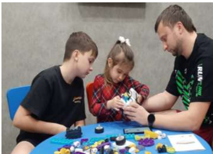
Фото 6. Семейная работа в рамках дистанционного взаимодействия.

Фото 5. Победители конкурса семейного технического творчества «Конструируем роботов в дружной семье».