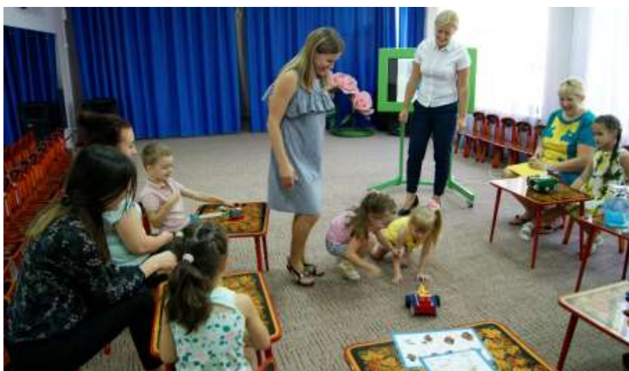
Фото 4. Фестиваль детско-родительских проектов «Семья и Робомир» (распространение семейного опыта по организации конструкторской деятельности)

Фото 3. Мастер-класс «Линейка конструкторов ArTecBlocks. Конструируем модели в формате 3D» (младший дошкольный возраст).