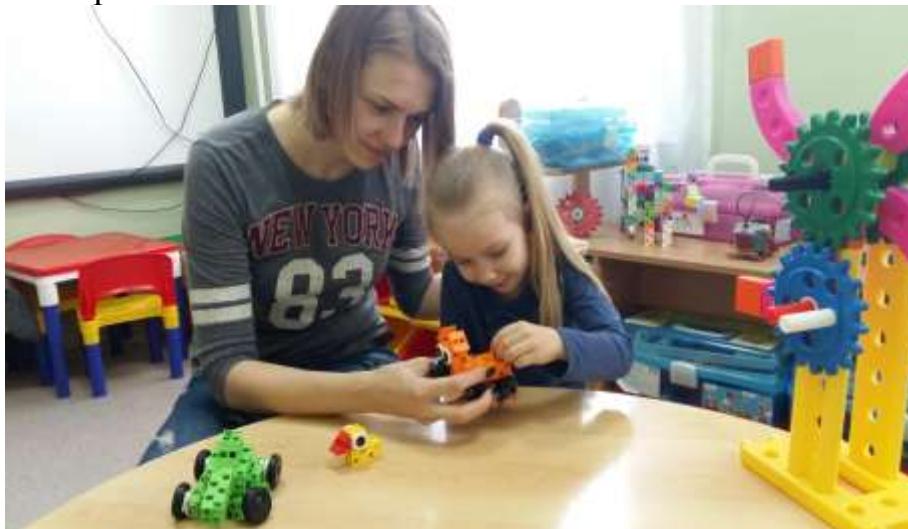
Фото 3. Мастер-класс «Линейка конструкторов ArTecBlocks. Конструируем модели в формате 3D» (младший дошкольный возраст).

Фото 2. Семинар-практикум «Формирование предпосылок инженерного мышления и развитие интереса к техническому творчеству средствами образовательной робототехники».