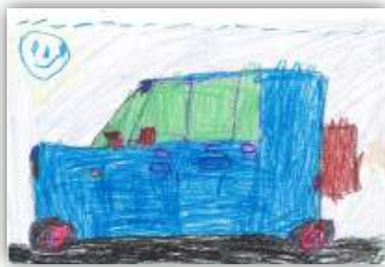
Машинка авт. Носироф Юсуф, 5 лет