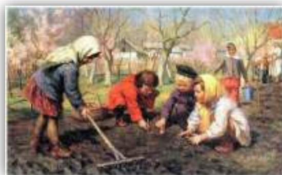
А. Бортников «Весна пришла»