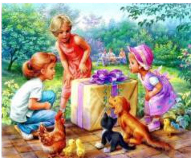
Марсель Марлье: иллюстрация из книги «Маруся и ее друзья. День рождения»