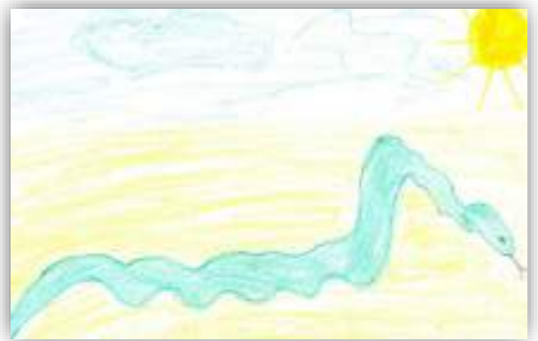
Моя змейка Авт. Будко Вероника, 5 лет