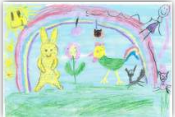
Я познакомилась с Чебурашкой авт. Будко Вероника, 5 лет