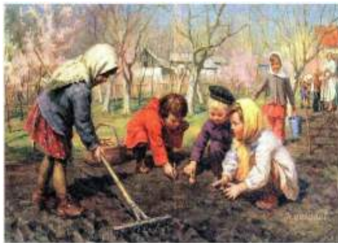
А. Бортников «Весна пришла»