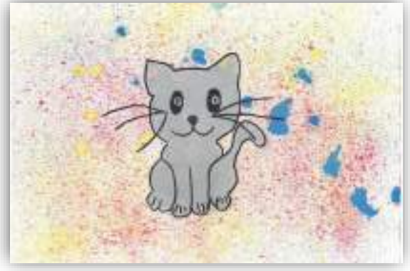
Пушистик авт. Захарян Дарина, 5 лет