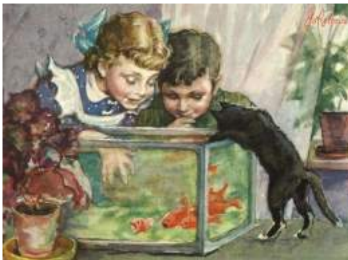
Светозар Остров «Запрещённое удовольствие»