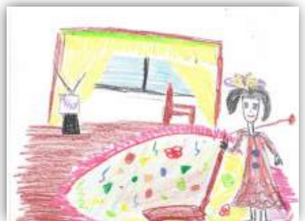
Помогаю маме авт. Захарян Дарина, 5 лет