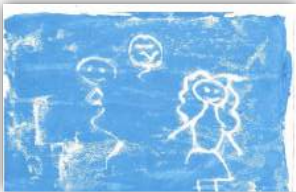
Зимние игры авт. Носироф Юсуф, 5 лет