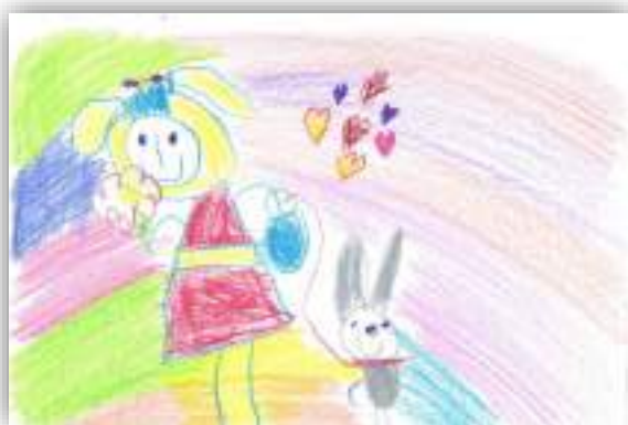
Зайки авт. Асланиди Софья, 5 лет