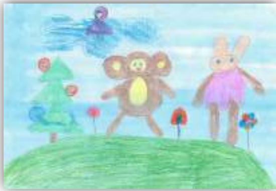
Я на радуге авт. Конопляник Алиса, 6 лет