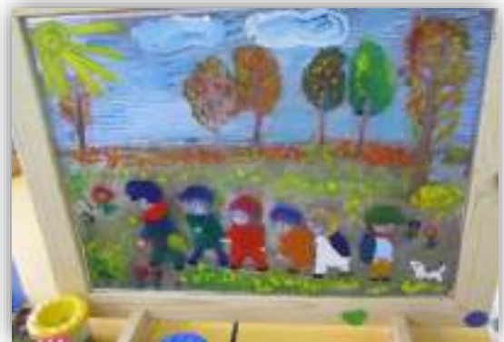
Меняем настроение Коллективная работа