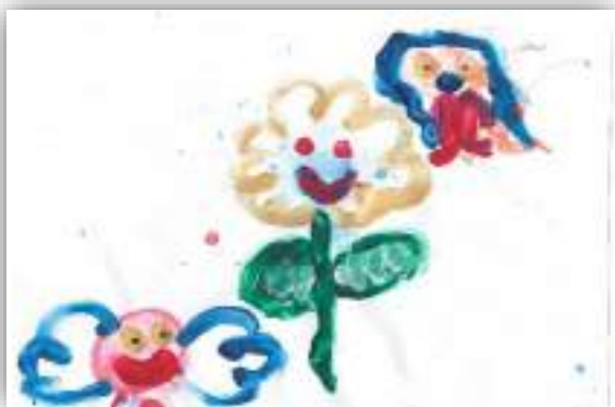
Радость авт. Котовщикова Мелиса