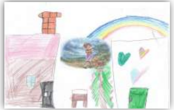
Красивая радуга авт. Саргсян Вардгес, 6 лет