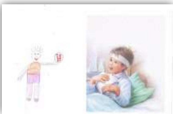
Конфеты для друга авт. Мирзоян Сережа, 5 лет