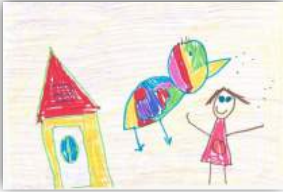
Подарок мечты авт. Сармина Эвелина, 5 лет