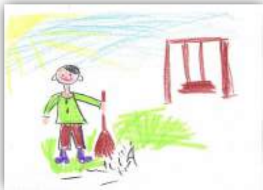
Я помогаю воспитателю авт. Носироф Юсуф, 5 лет