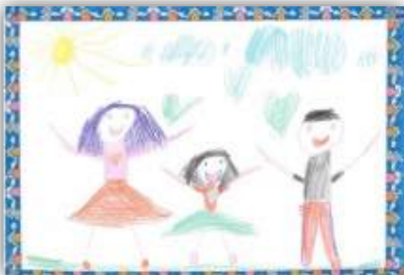
Мы вместе авт. Котовщикова Мелиса, 6 лет