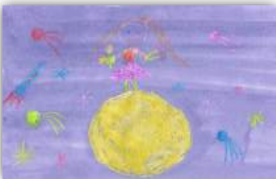
Собираю цветы на луне авт. Петросян Валя, 6 лет