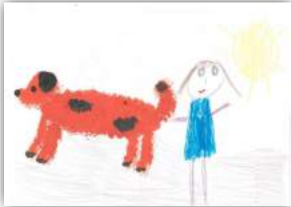
Прогулка с собачкой авт. Хачатрян София, 6 лет