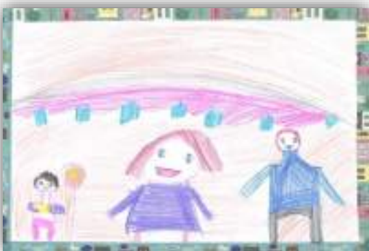
Большая радость авт. Саргсян Вардгес, 6 лет