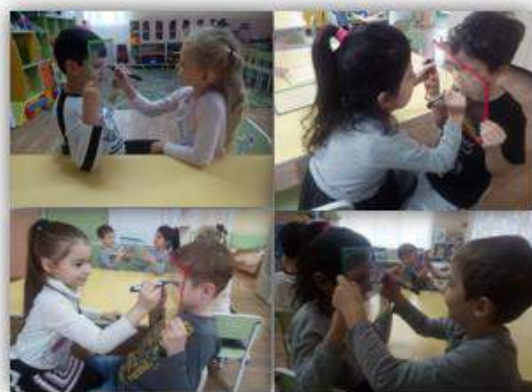
Портрет друга авт. Дети подготовительной к школе группы