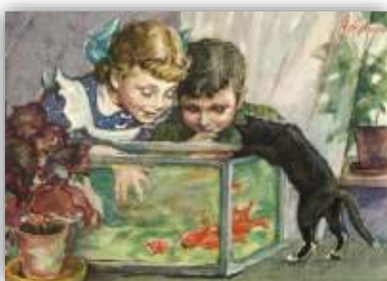
Светозар Остров «Запрещённое удовольствие»