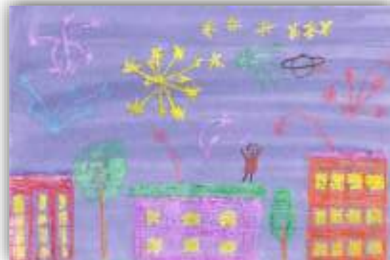
Город мечты авт. Мирзоян Сережа, 5 лет