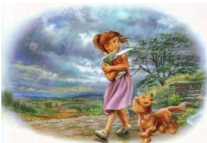
Марсель Марлье: иллюстрация из книги «Приключение Маруси»