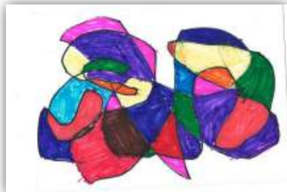
авт. Мирзоян Сергей, 5 лет