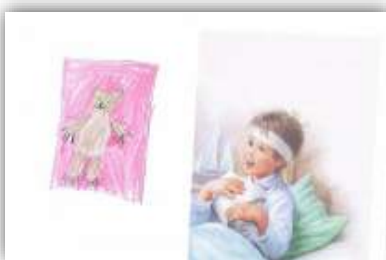
Подарок другу авт. Руденко Ксения, 6 лет