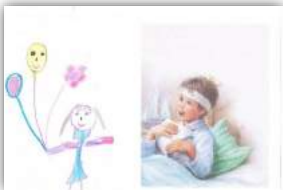
В гости к больному другу авт. Хачатрян София, 6 лет