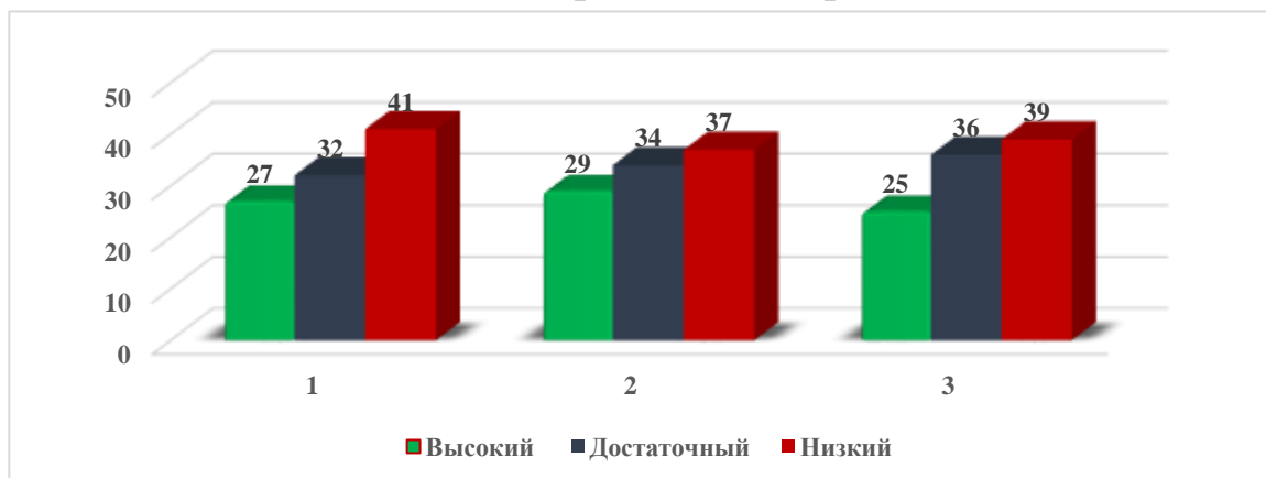
Таблица 1. Оценка сформированности основ финансовой грамотности в начале реализации проекта (2020г)