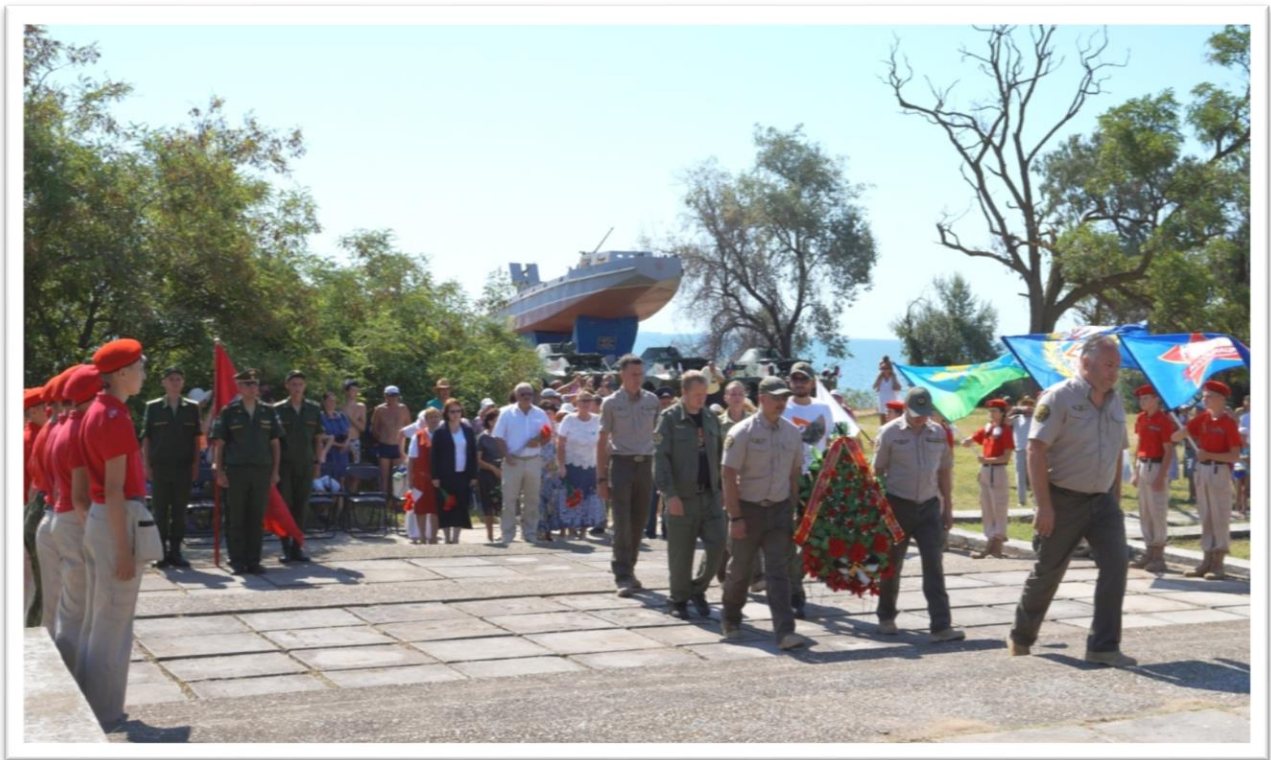
Участие юнармейцев в акции «Эльтиген - дорога мужества» г. Керчь, пос. Героевка