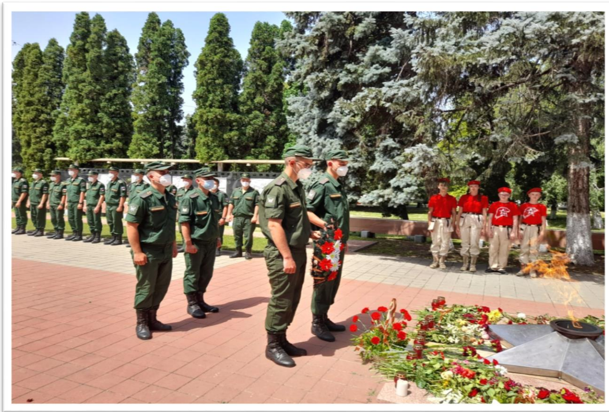
Прием в ряды ВВПОД «ЮНАРМИЯ» в войсковой части