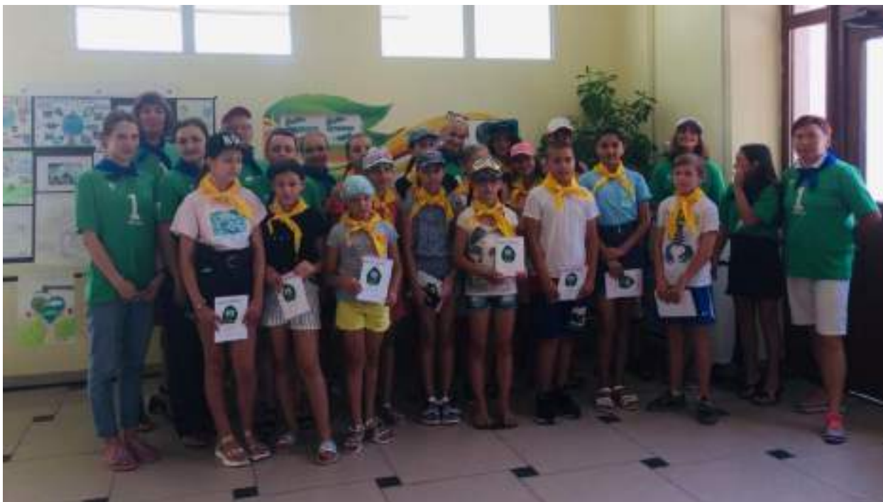
Рисунок 2. Торжественное открытие ЭКОшколы «ЗДРАВики»

Для ребят запоминающимся событием стало посвящение в ЗДРАВики (рис 2.), им повязали галстуки и вручили Дневник (Приложение №1) для ежедневного заполнения. В Дневнике отражен главный девиз «Живи ЭКОлогично и вдохновляй других», Правила ЭКОшколы, Памятка ЭКОповедения, маршрут по станциям, Программа мероприятий на каждый день, а также место для рефлексии каждого участника.