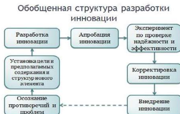
Рисунок 1 – Обобщенная структура разработки инновации.

На теоретико-методологическом уровне наиболее фундаментально проблема нововведений отражена в работах М.М. Поташника, А. В Хуторского, Н Б Пугачёвой, В.С. Лазарева, В.И Загвязинского с позиций системно-деятельностного подхода, что дает возможность анализировать не только отдельные стадии инновационного процесса, но и перейти к комплексному изучению нововведений. Обобщенная структура разработки инновации в любой сфере представлена на рисунке 1: