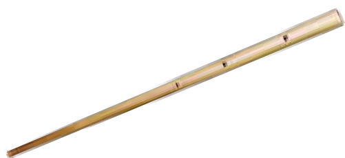
Камыль — адыгская флейта