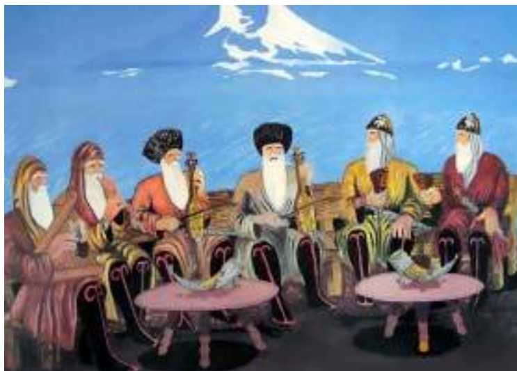
Ансамбль пожилых адыгов

Пшыне – адыгейская гармонь. В исполнении танцевальных адыгейских мелодий он великолепен и прекрасен.