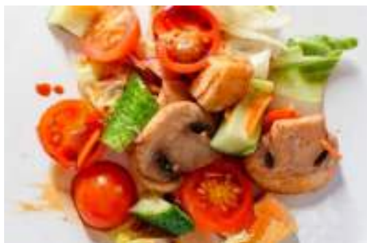
Салат с адыгейским сыром