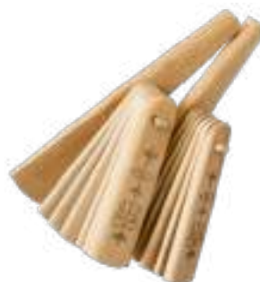
Пхачич – трещотки