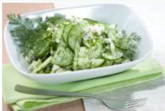
Огуречный салат с адыгейским сыром