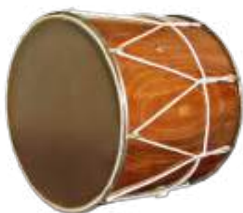
Давул – барабан