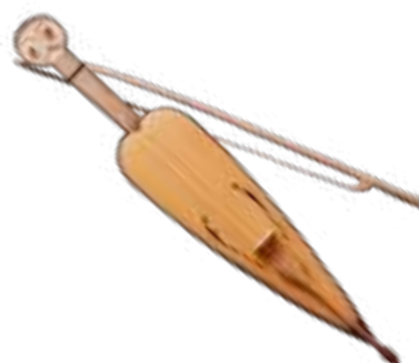
Шичешин — адыгейская скрипка

Задание. Рассмотрите адыгейские музыкальные инструменты. Какие из них ты видел и слышал? Где?