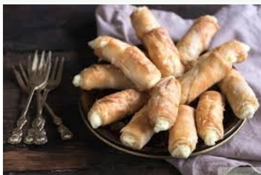
Слоёное печенье с адыгейским сыром

Задание. Постарайся запомнить названия блюд адыгейской кухни.