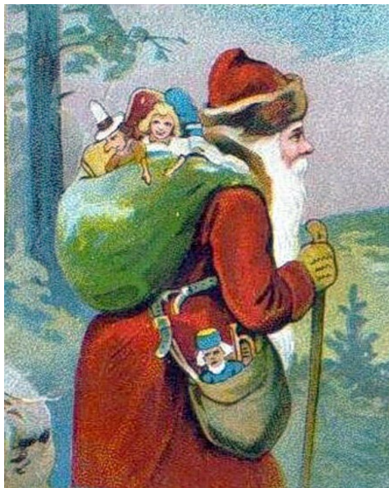
Российский Дед Мороз

Задание. День Святого Василия совпадает с празднованием Нового года, поэтому для греков этот святой стал подобен российскому Деду Морозу. Сравни изображения и скажи, чем греческий Святой Василий похож на российского Деда Мороза. А чем они различаются?