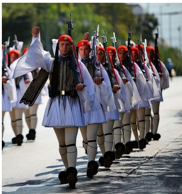
Часовые почетных караулов в народном греческом костюме.

Чтобы не попасть в неловкое положение следует знать, что «нэ» по-гречески означает «да», «нет» — «охи». Отвечая «нет», грек кивает головой снизу вверх, а не из стороны в сторону (в этом случае он хочет показать, что не понимает). Язык жестов здесь считается очень важной частью разговора.