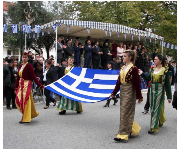
25 марта — День независимости Греции