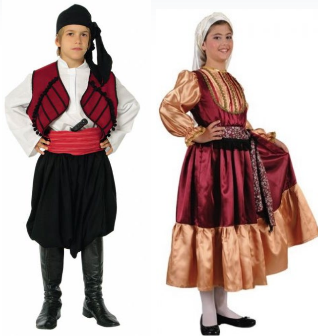
Национальные костюмы понтийских греков

Задание 2. Рассмотрите рисунки и раскрасьте костюм греческого мальчика.