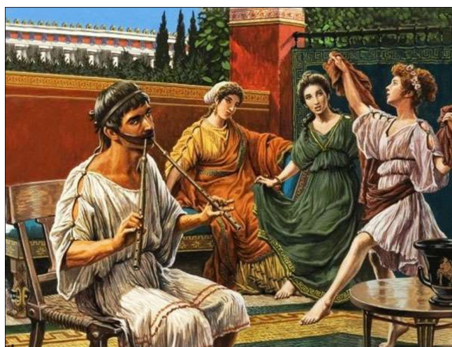
Танцы под Авлос

Корпус – деревянная трубка с 3-5 отверстиями. Существовали также двойные авлосы с трубками одинаковой либо разной длины.