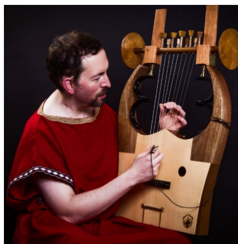
Игра на арфе