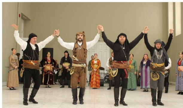
Танцуют понтийские греки

Сиртаки не народный танец, но его полюбили и в Греции, и во многих странах мира. Он очень задорный, его весело танцевать группой.