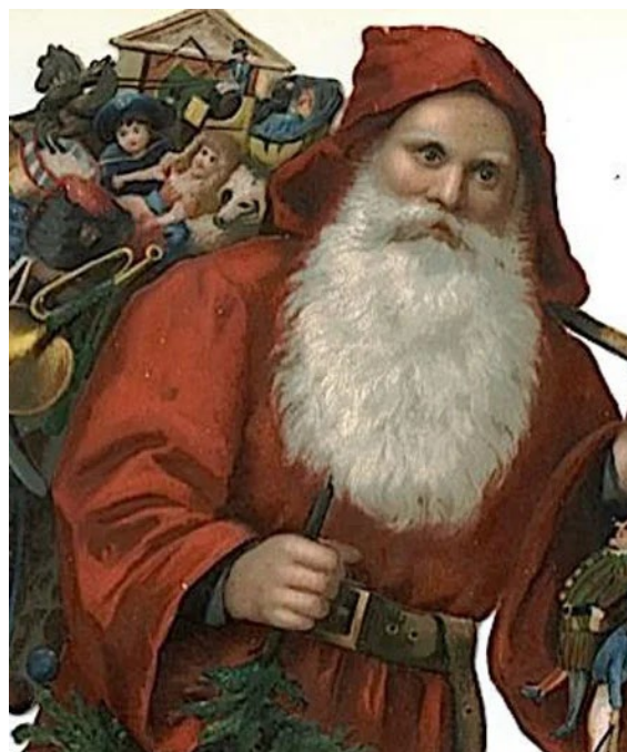
Греческий Святой Василий