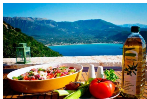
Салаты с сыром