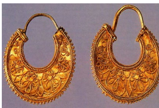
Изготовление ювелирных украшений