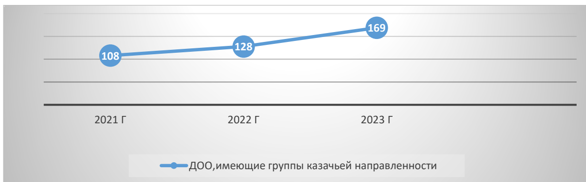
Рис.1 Группы казачьей направленности в ДОО Краснодарского края (2021- 2023).