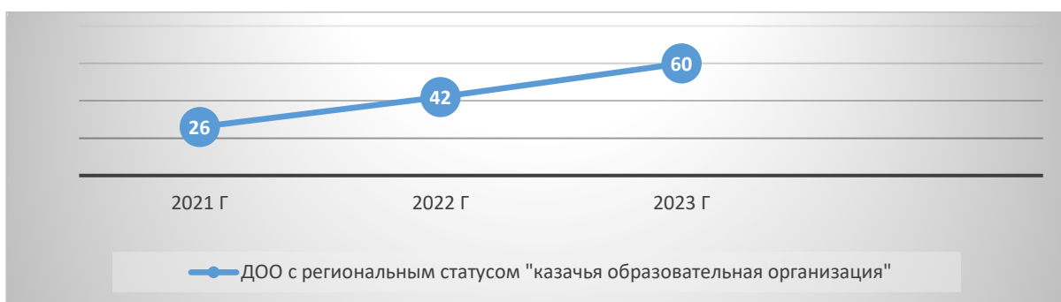
Рис. 2 Дошкольные образовательные организации с региональным статусом «казачья образовательная организация» Краснодарского края (2021 - 2023)