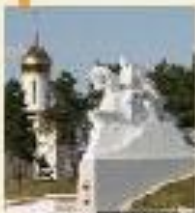
Поле Казачьей Славы