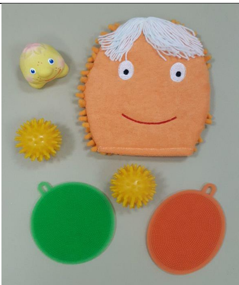
Силиконовые губки, варежка, резиновый Колобок