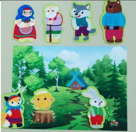
Настольная игра «Колобок» (с магнитной основой)