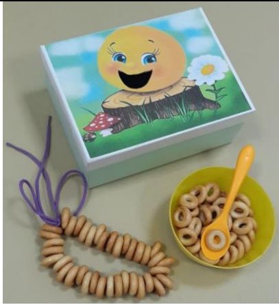
Игра «Покорми Колобка»