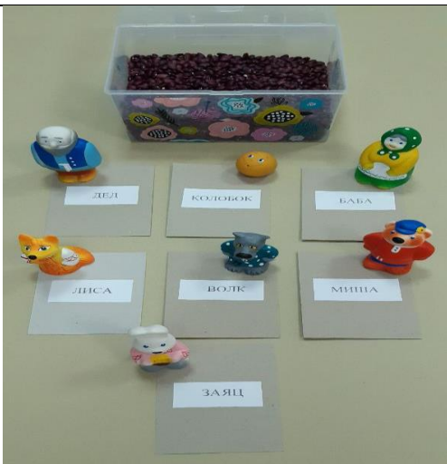
Сенсорная коробка с фигурками-персонажами сказки «Колобок»