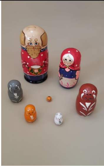
Матрешка «Сказка Колобок»