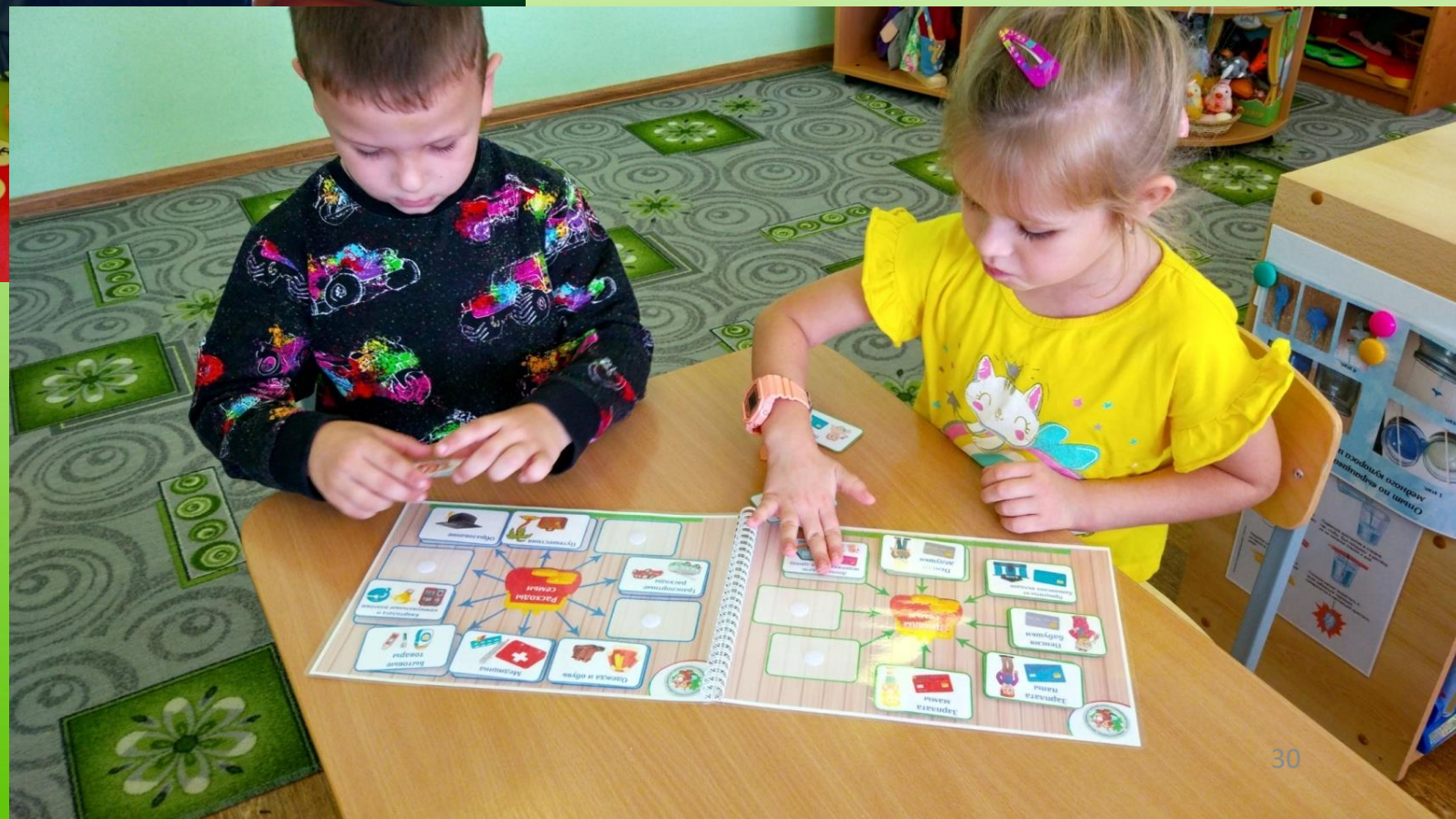
Дидактическая игра «Доходы и расходы семьи»