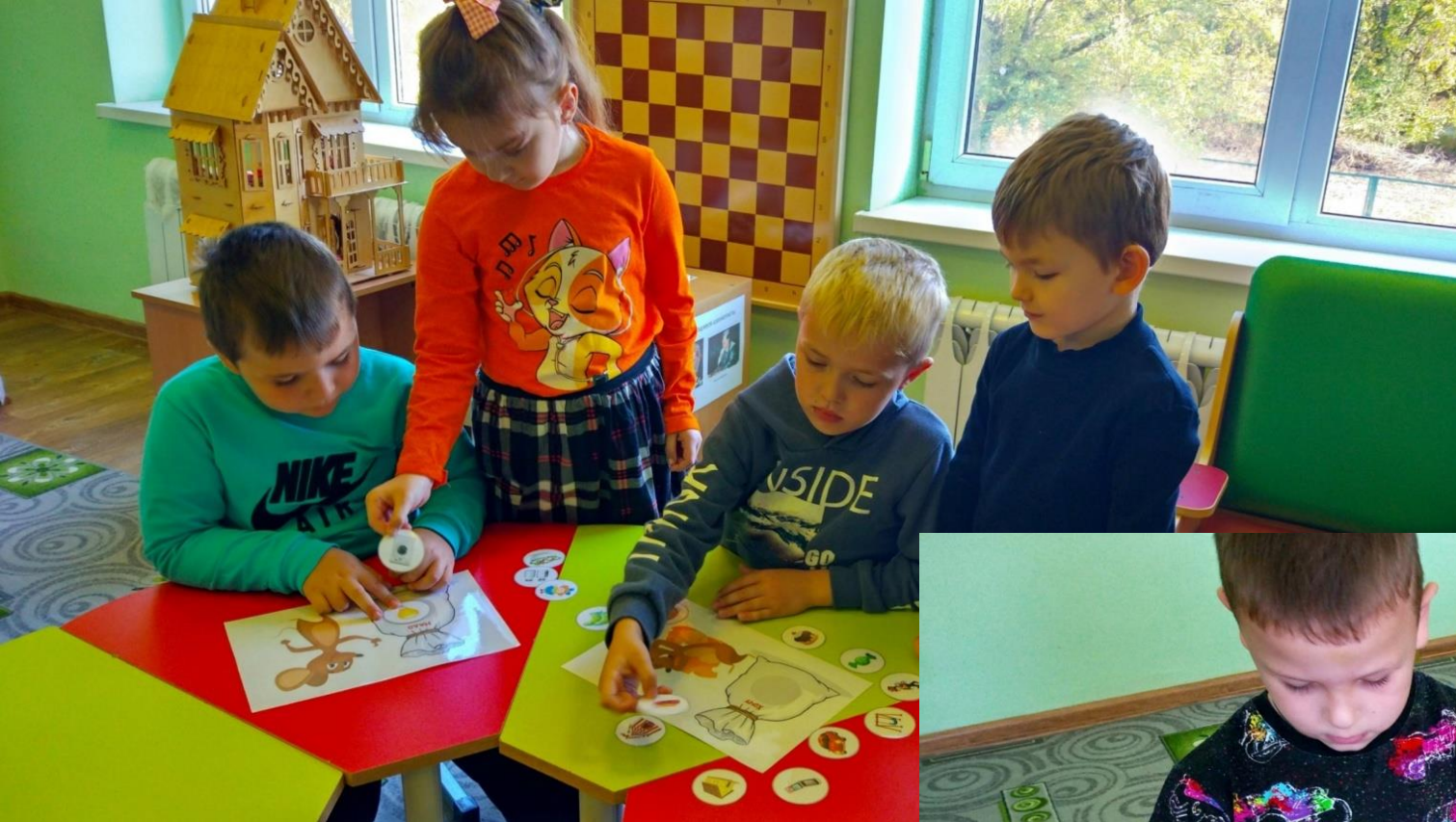
Дидактическая игра «Хочу и надо»