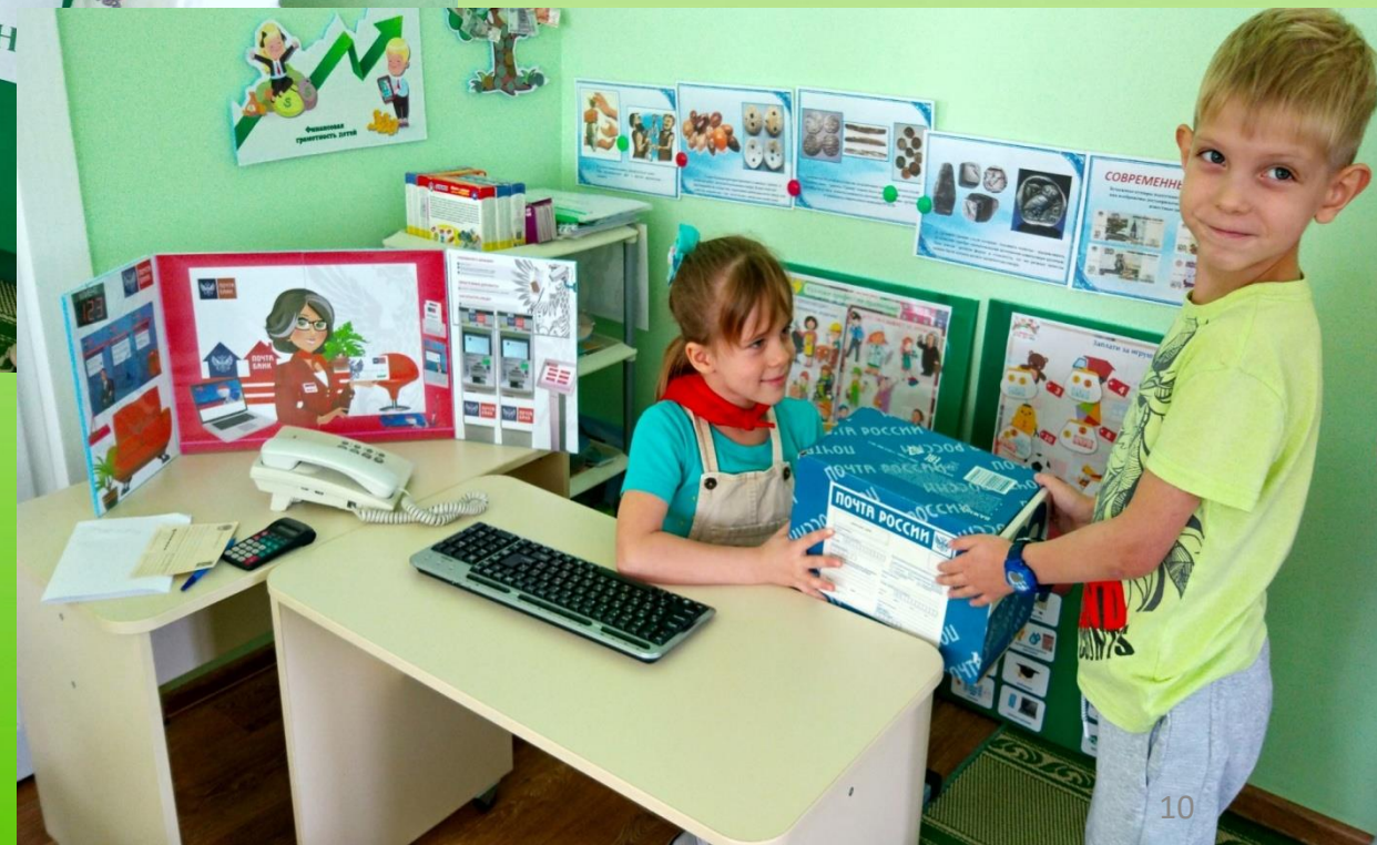
Сюжетно – ролевая игра «Банк»