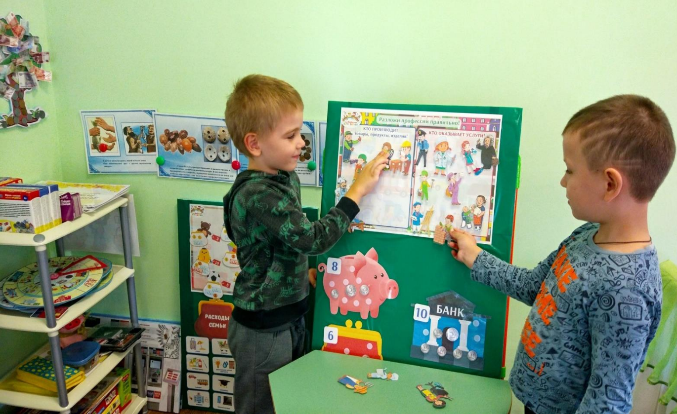
Дидактическая игра «Кто производит товары и кто оказывает услуги»