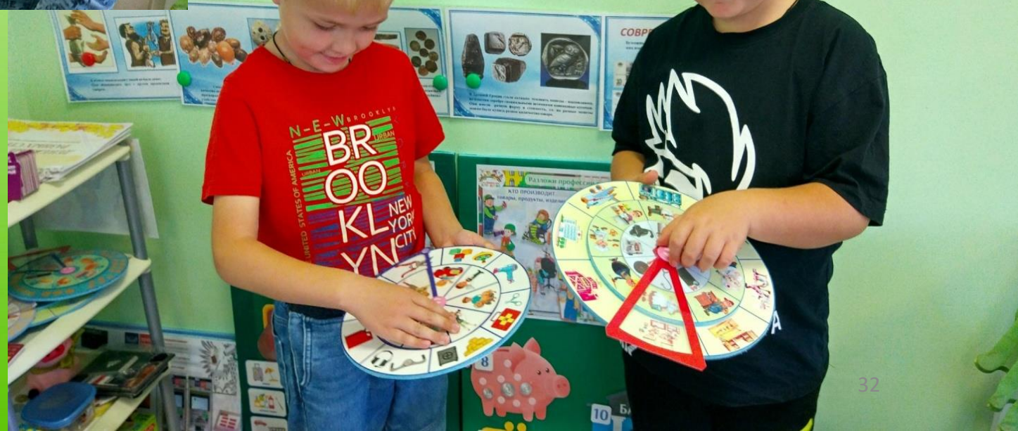
Дидактические игры «Круги Луллия: профессии» «Банк, копилка, кошелек»