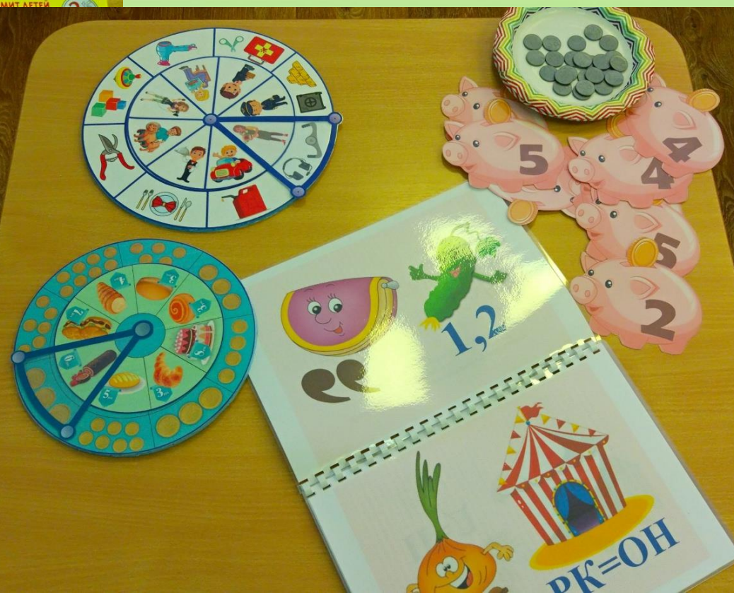
Дидактическая игра «Положи деньги в копилку»