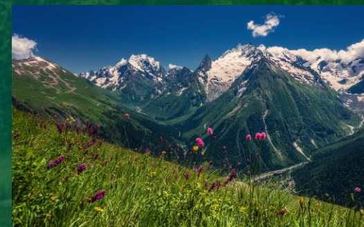
Области высотной поясности Кавказа