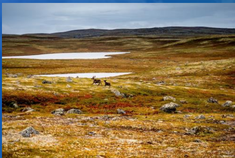
Тундра и лесотундра