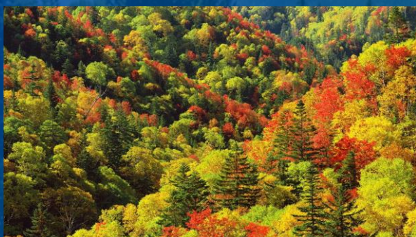
Лиственный и смешанный лес