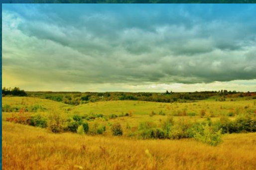
Лесостепи, степи, полупустыни