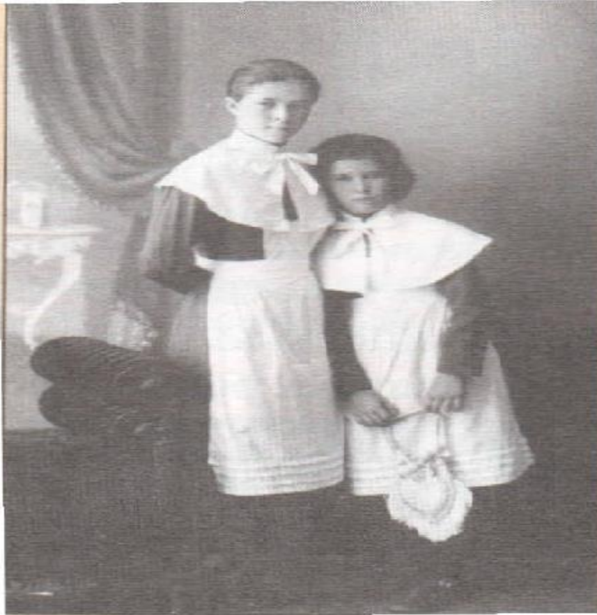
Гимназистки. Фотография конца XIX в.

Во второй половине XIX в. На Кубани было положено начало профессиональному и женскому образованию.