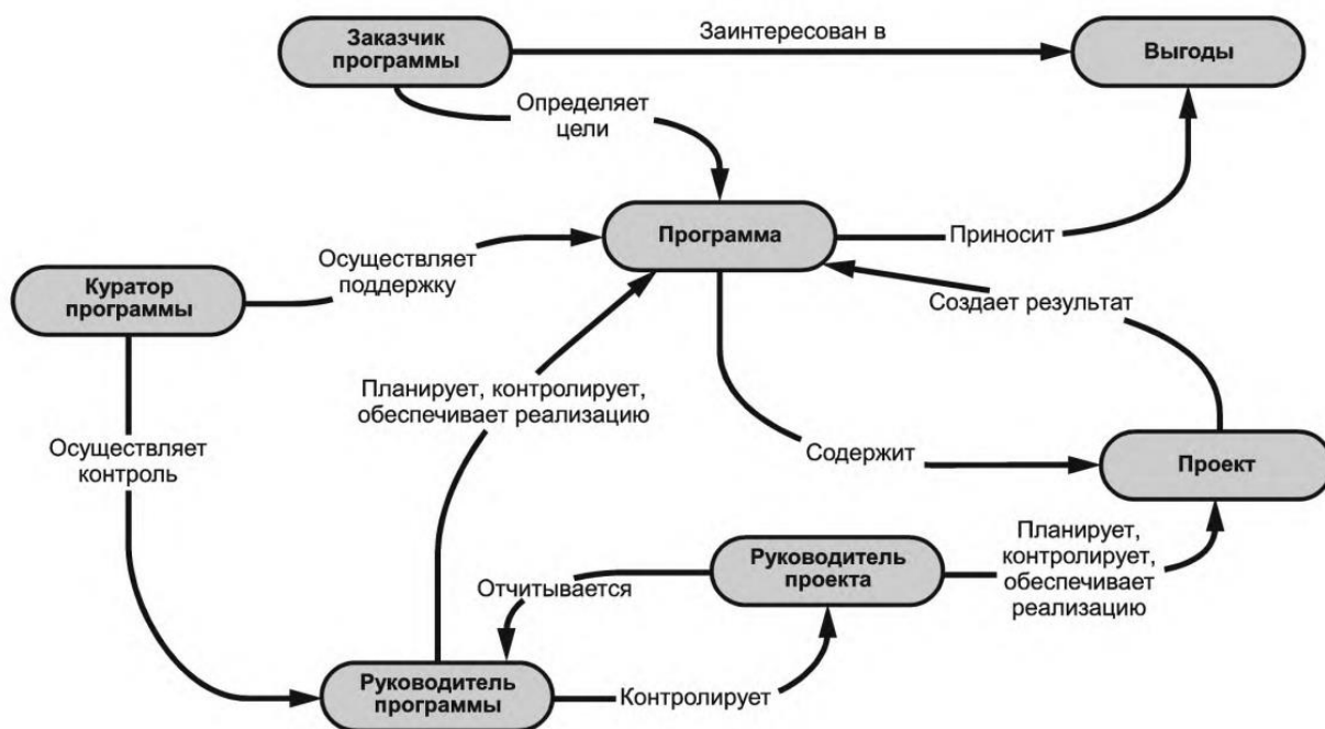
Рисунок 2. Основные понятия менеджмента программы и их взаимосвязь

Для программ, реализуемых в сфере образования, понятие «выгода» по большей части неуместно, в представленных схемах применительно к отрасли следует эту позицию заменить на «изменение состояния», «результат» или «эффект».