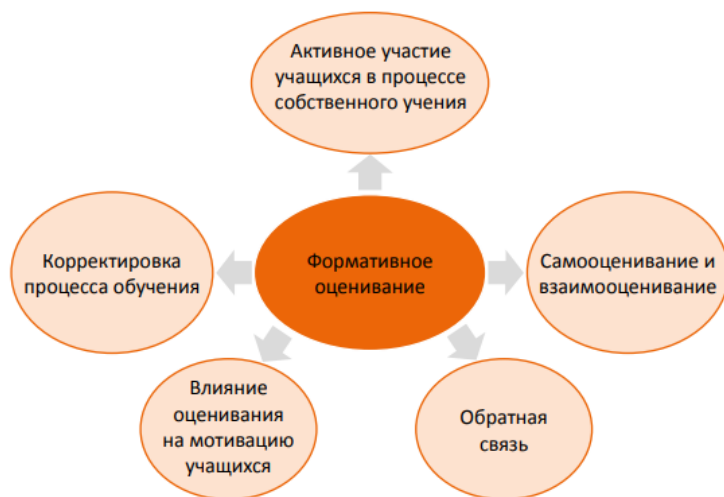
Схема 1. Компоненты формативного оценивания

Формирующее оценивание состоит из нескольких компонентов. Они представлены на схеме (См. Схема 1. Компоненты формативного оценивания)