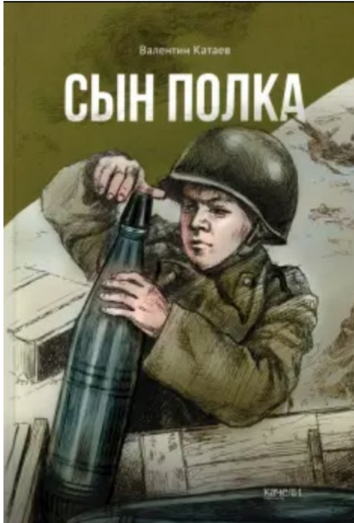
Катаев В. «Сын полка»

Валентин Петрович Катаев написал свою повесть «Сын полка» в 1944 году, в дни Великой Отечественной войны нашего народа с фашистскими захватчиками. Свыше семидесяти лет прошло с тех пор. Война принесла нашей стране много горя, бед и несчастий. Она разорила сотни городов и сёл. Она уничтожила миллионы людей. Она лишила тысячи детей отцов и матерей. Но советский народ победил в этой войне. Победил потому, что был до конца предан своей Родине. Победил потому, что не мог не победить: это была справедливая война за счастье и мир на земле.