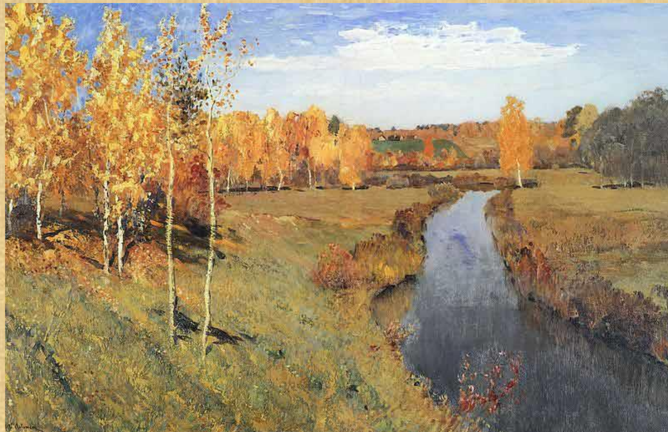
И.И. Левитан «Золотая осень»

Исторический аспект в процессе обучения родному русскому языку позволяет формировать ценностное отношение школьников к различным языковым явлениям, способствует развитию языковой личности, а также обогащению словарного запаса учащихся.