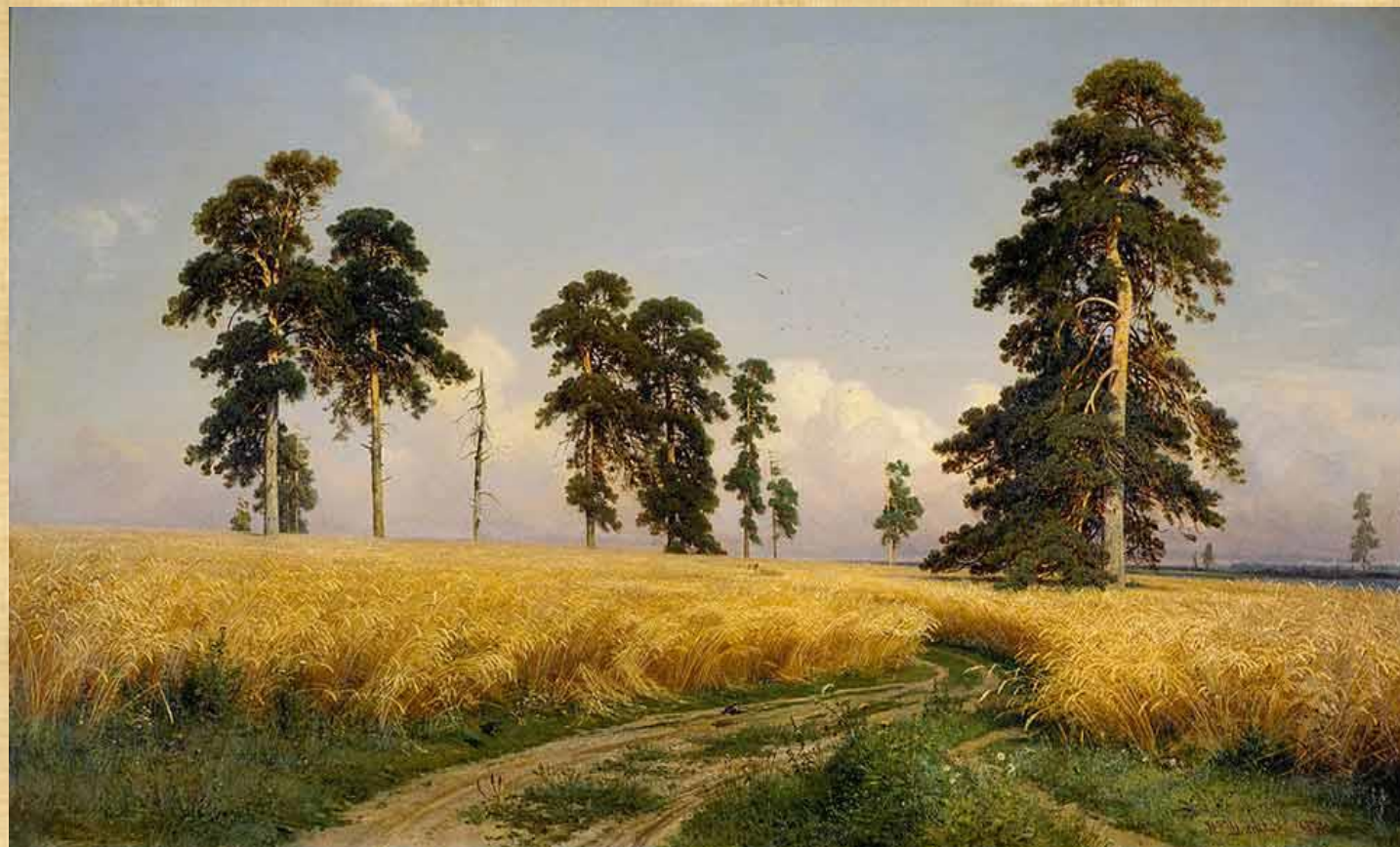
И. Шишкин «Рожь»

Родной язык — это сокровищница, кладовая, копилка национальной культуры.