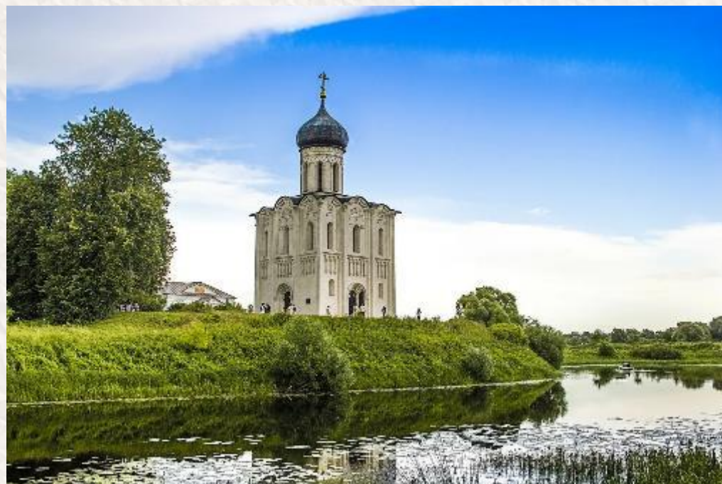
Храм Покрова на Нерли