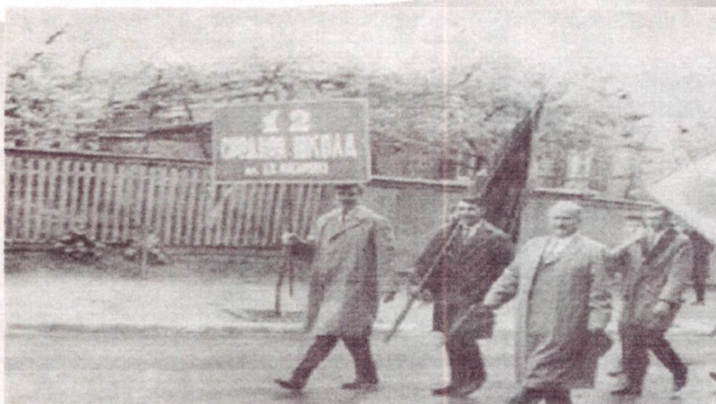
Школа стала культурным центром города.

единили со школой женской и присвоили № 12).