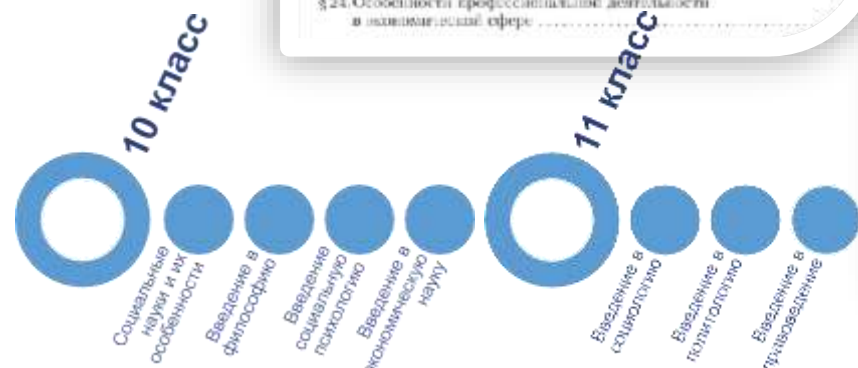
Разделы содержания по годам обучения