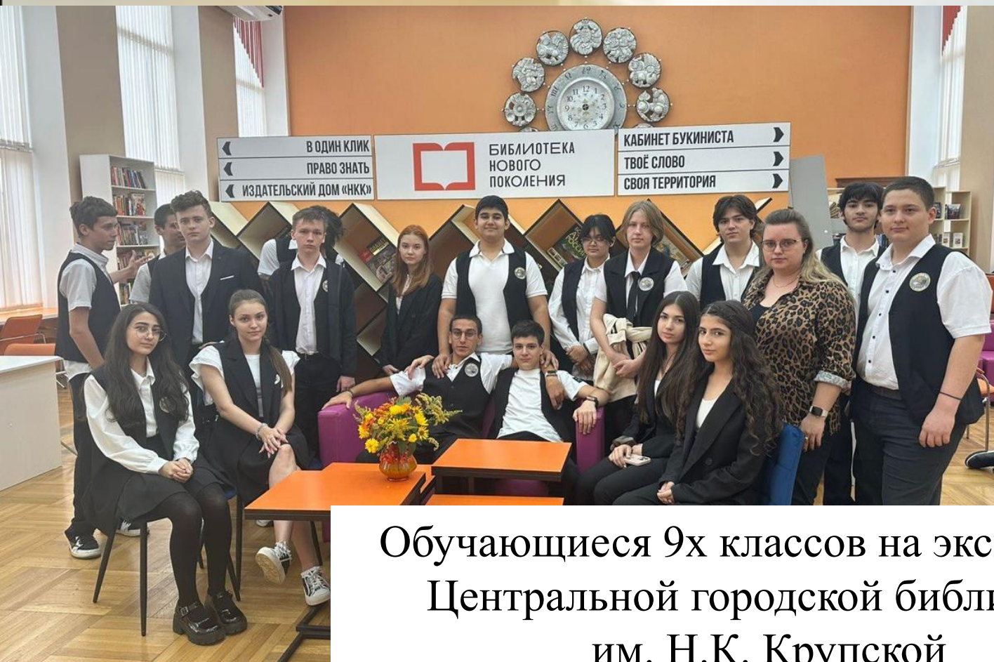
Обучающиеся 9х классов на экскурсии в Центральной городской библиотеке им. Н.К. Крупской