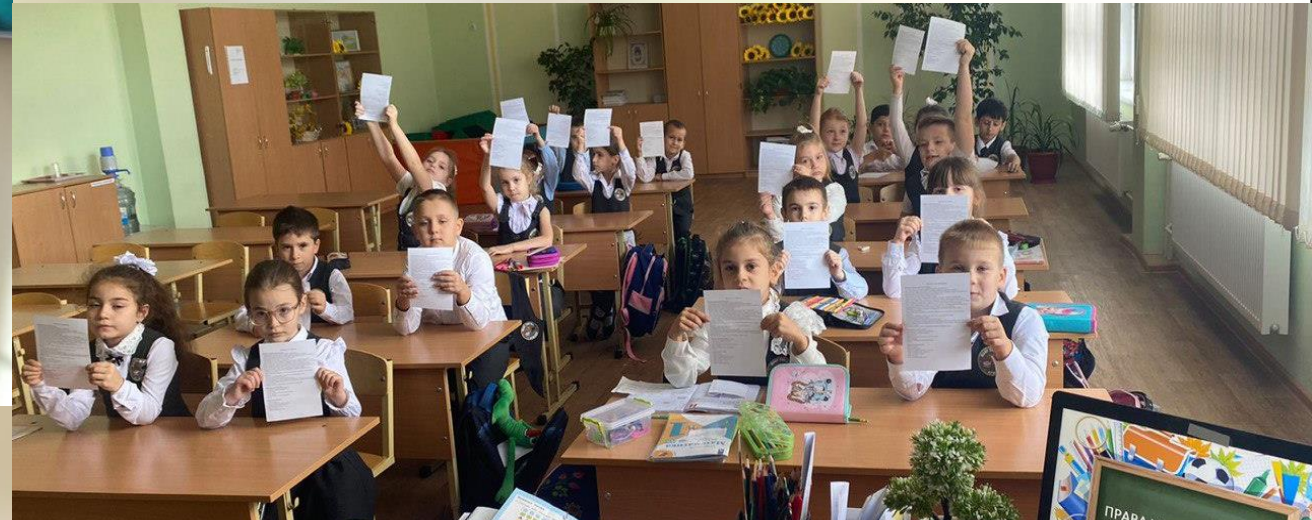
Библиотечный урок-викторина с обучающимися 2 класса «Права и обязанности школьника»