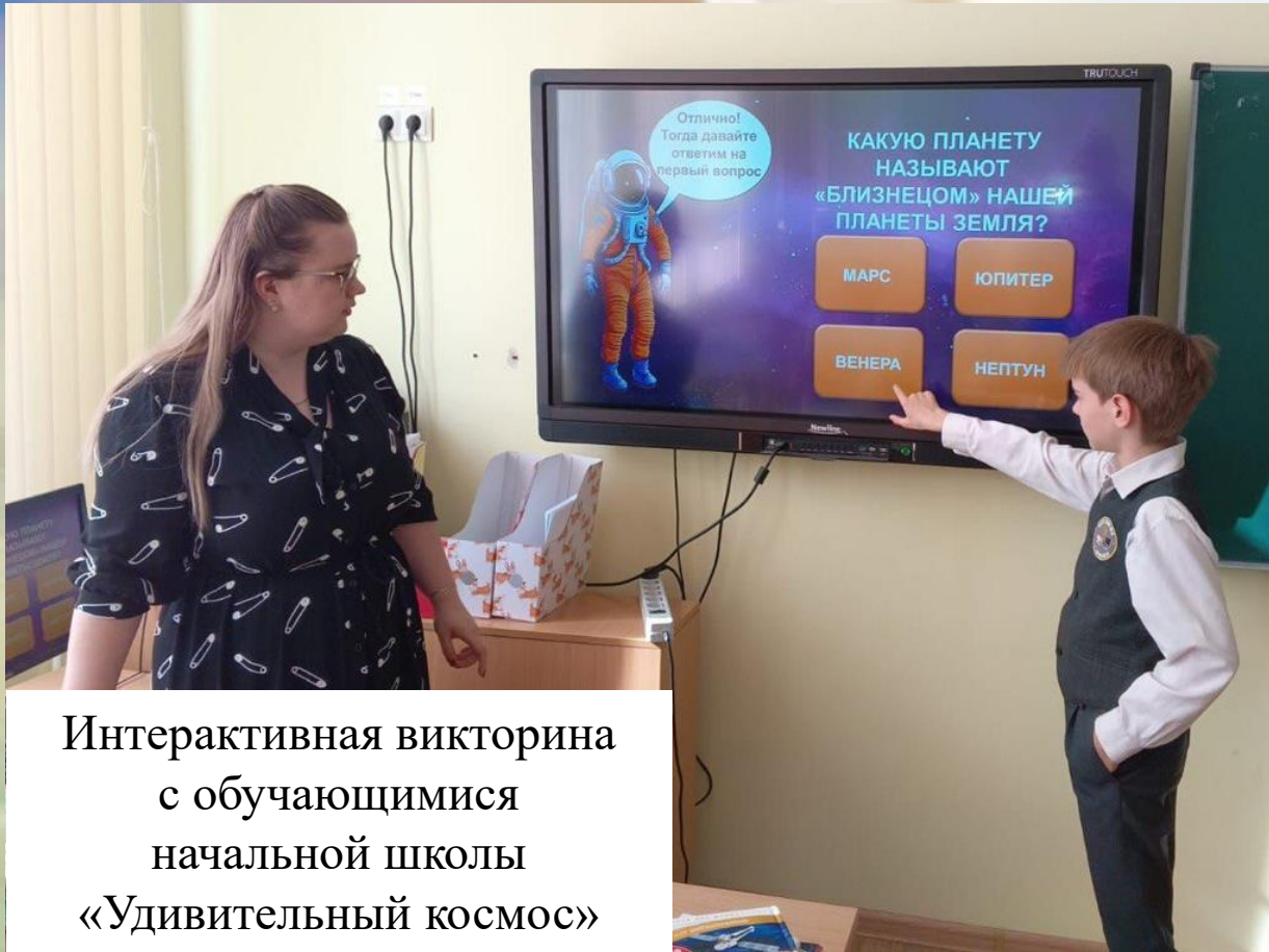
Интерактивная викторина с обучающимися начальной школы «Удивительный космос»