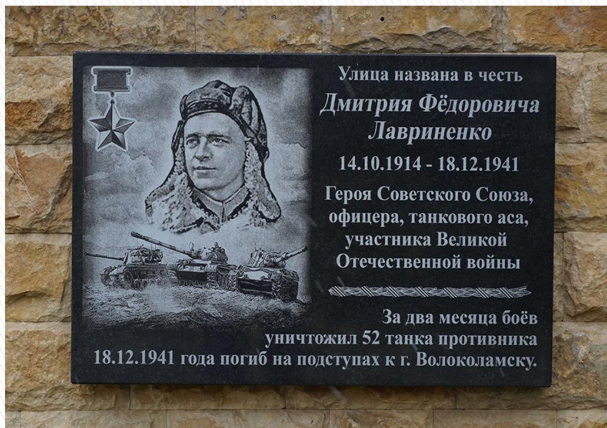
Памятная доска на ул. Лавриненко Д.Ф. в г. Армавире Краснодарского края