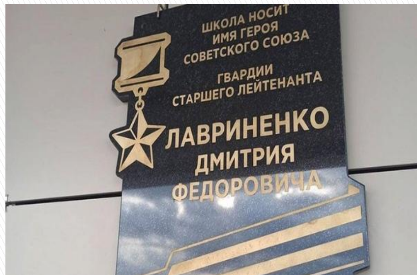
Школы им. Лавриненко Д.Ф. МБОУ СОШ № 32 хутора Сладкий Лабинского района МБОУ СОШ № 28 ст. Бесстрашной Отрадненского района Краснодарского края