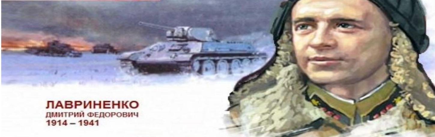
ЛАВРИНЕНКО ДМИТРИЙ ФЕДОРОВИЧ 1914 – 1941