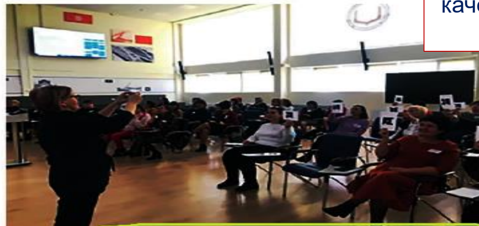
Рисунок 2. Заседание регионального сообщества учителей начальных классов

Рекомендуемое качество фотографий – 1 мб и более