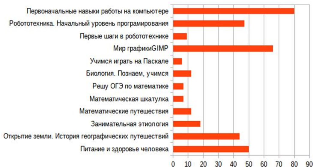
Диаграмма 2 Популярность программ дополнительного образования социально-гуманитарной направленности