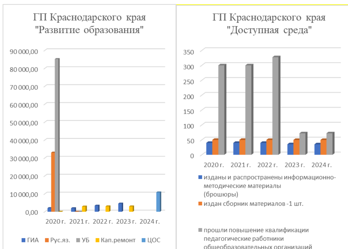
Рисунок. Анализ освоения целевых субсидий в рамках выполнения государственных программ Краснодарского края