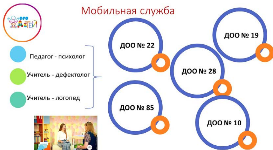
Рис. 2 Мобильная служба

А нужна ли родителям такая форма работы?