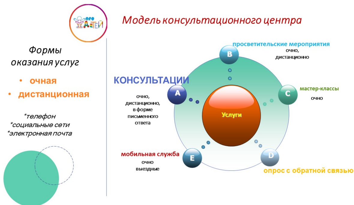
Рис.1 Модель консультационного центра

оставшихся без попечения родителей. Ежедневно специалисты консультационного центра - педагоги-психологи, учитель – логопед, учитель – дефектолог, педагоги дополнительного образования, воспитатели, старший воспитатель – проводят консультации для родителей. Услуги оказываются на безвозмездной основе. Модель консультационного центра (рис.1).