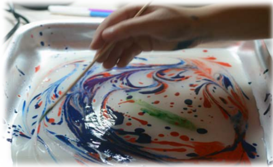
Рис. 1 Техника «Эмбру»

краски использовать масляные, в которые также добавляют клей. Этими красками наносят рисунок на поверхность воды, а затем опускают на воду лист бумаги, аккуратно достают и дают высохнуть. Разумеется, эта техника – подобие эбру. Но, тем не менее, для детей это необычно, это тоже будет рисование на воде, и результат может оказаться очень красивым и своеобразным. А главное – собственноручно выполненным и уникальным.