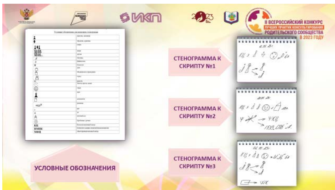
Рис. 2 Стенограмма

С целью организации лаконичного рабочего пространства в роли инструментов были разработаны методические рекомендации, сборник КЦ для навигации получателей услуг, а также макеты для диспетчера при обращении в КЦ.