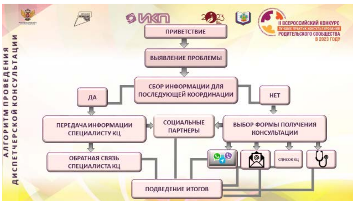
Рис. 1 Алгоритм проведения диспетчерского консультирования

Построенный нами алгоритм представляет собой шесть основных шагов в работе диспетчера: приветствие, выявление проблемы, сбор информации для последующей координации, передача информации специалисту КЦ, выбор формы консультирования, подведение итогов. Схематично данный алгоритм представлен на (рис. 1).