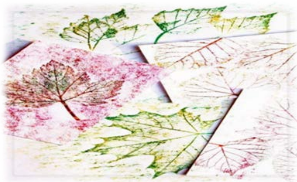
Рис. 5 «Фротажж»

Рисование для дошкольника – это захватывающий мир ярких, удивительных образов. Изучение техник рисования разных стран мира становится своеобразным толчком к развитию воображения и творческих способностей у детей. Комбинируя различные методы изображения в одном рисунке, дошкольники могут проявить свою индивидуальность и более полно выразить впечатления об окружающем мире, предметах, явлениях или событиях в жизни. Таким образом, развивается творческая личность, способная применять свои знания и умения в различных ситуациях.