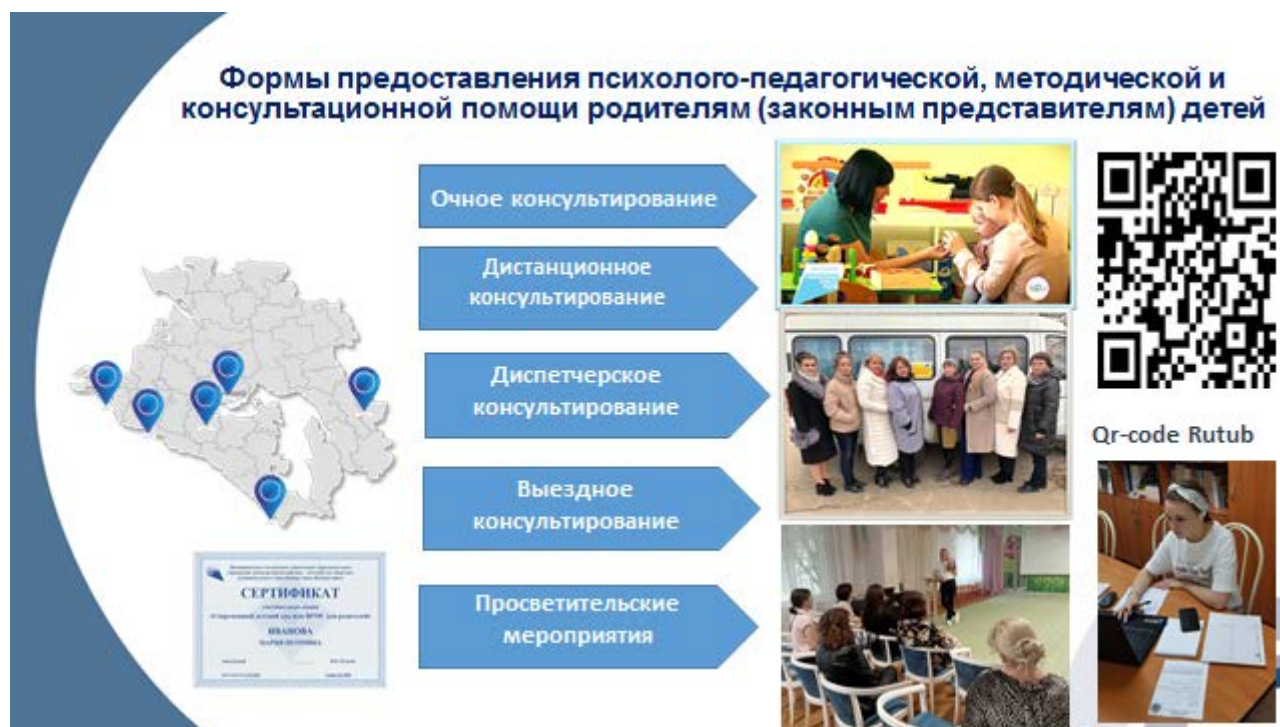
Рис. 1. Формы предоставления психолого-педагогической, методической и консультационной помощи родителям (законным представителям) детей

представители) могут обратиться за консультацией к различным специалистам по интересующим вопросам или за решением проблемы. Работа специалистов центров проводится в очном или дистанционном режиме, в формате просветительских мероприятий и выездных консультаций (рис. 1).