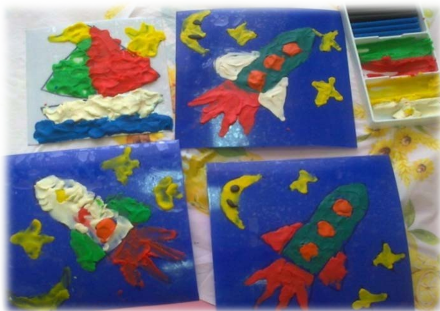
Рис. 2 Техника «Витраж»

Следующее путешествие в Германию и знакомство с техникой рисования « витраж ». Для выполнения работы в данной технике нам понадобятся: пластик (это могут быть пластмассовые прозрачные крышки разных форм и размеров), маркер и пластилин (рис. 2). Наносим на пластик рисунок маркером (можно с обратной стороны приклеить цветной фон) и затем ребенок «раскрашивает» данный рисунок масляными красками, гуашью, пластилином. Это безопасно и очень увлекательно.