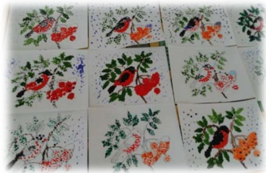
Рис. 3 Техника «Пуантилизм»

Следующая техника рисования пришла из Франции и называется она « пуантилизм », что обозначает «рисование точками разного цвета» (рис. 3). Рисуя в данной технике, можно использовать различные материалы: это могут быть ватные палочки, простой карандаш с ластиком на другом конце, фломастеры, также можно использовать обычные салфетки (скатываем в шарики и вот материал для творчества), дети могут рисовать и просто пальчиками.