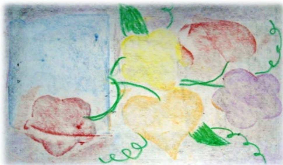
Рис. 4 Техника «Фроттаж»

можно приклеить их клеем ПВА к листу А4. Накрыть композицию белой бумагой и натереть восковыми мелками (боковой стороной) или заштриховать карандашом. Детские рисунки в стиле фроттаж хорошо дополнять аппликациями из цветной бумаги, рамками паспарту (рис 4, 5).