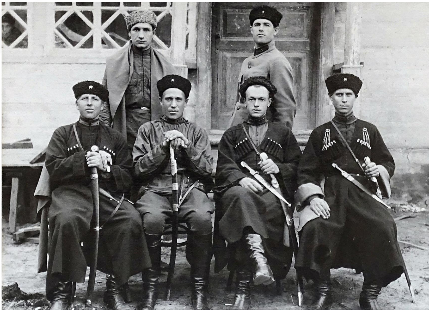
Командный состав 1-го эскадрона 88-го Армавирского кавалерийского полка, 1928 год.