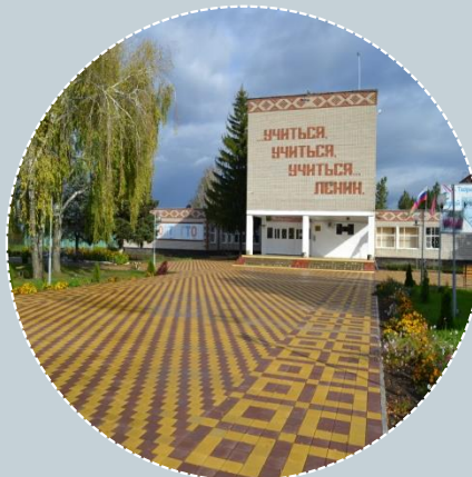
МАОУ СОШ № 11