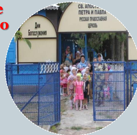
Храм св. Апостолов Петра и Павла