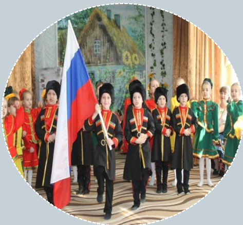
МБДОУ № 33