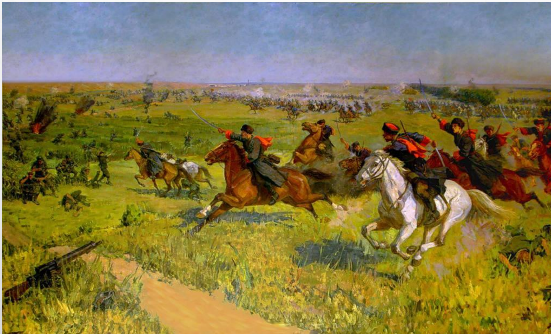
"Атака под Кущёвской кубанских казаков 2 августа 1942 года". Художник С.М. Зелихман.