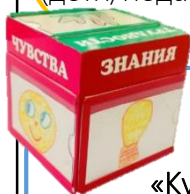
«Куб - помощник»

По всем направлениям составлены вопросы, которые могут меняться и дополняться, в зависимости от категории участников рефлексии (дети/педагоги/ родители)