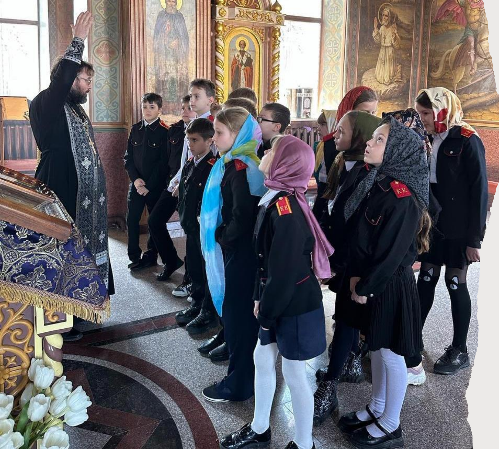
Свято-Никольский храм с. Архипо- Осиповка