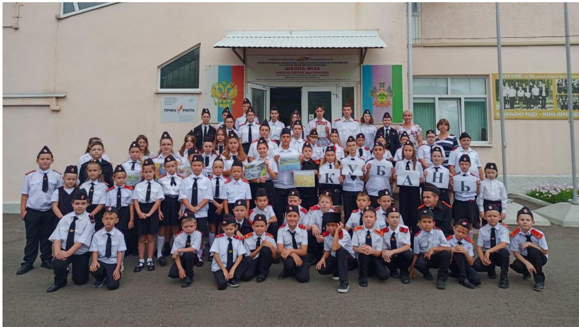
МБОУ ООШ №24 имени Сергея Цыганкова