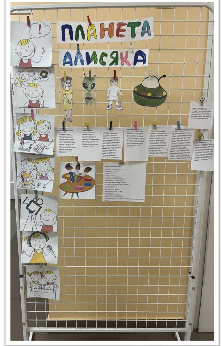
Мультэкран, 4 этап

Изготовление ребятами недостающих деталей (буквы для названия, слова для титров, другие детали)