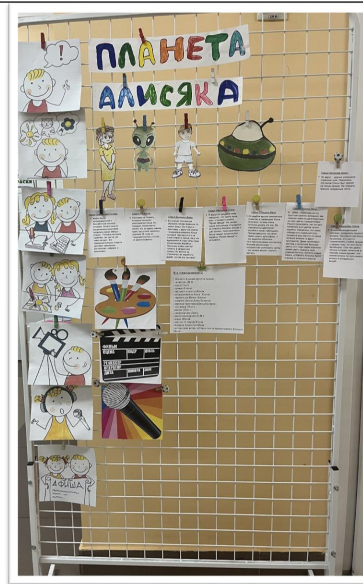
Мультэкран, 6 этап