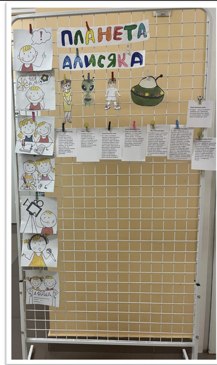
Мультэкран, 3 этап

Итогом такого взаимодействия являются авторские мультфильмы, снятые нами в группе, но уже по замыслу семей.