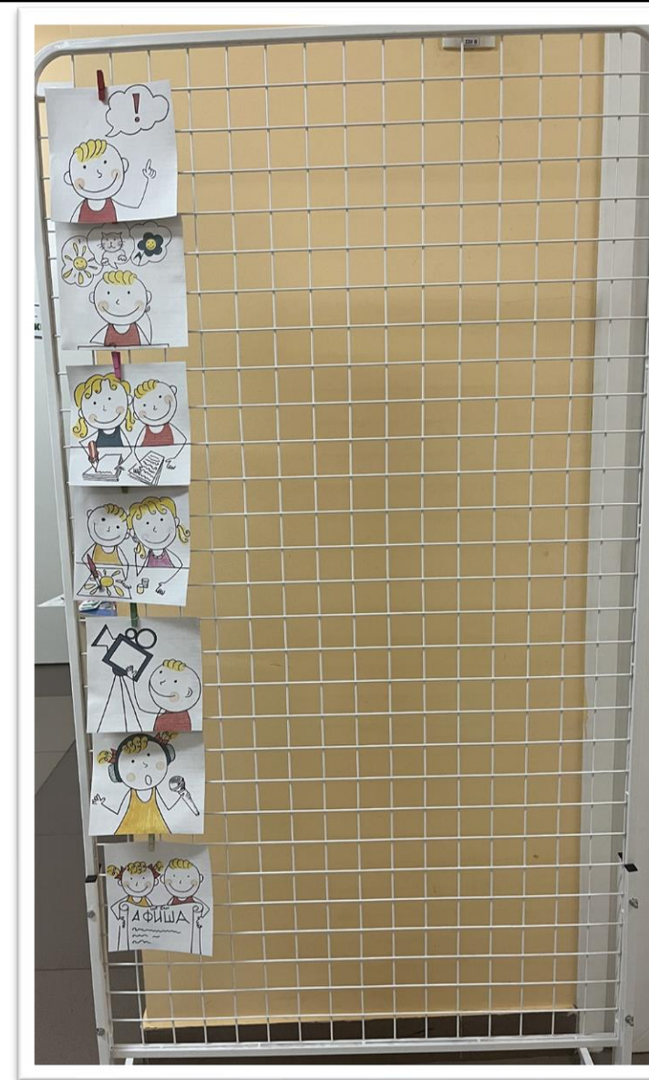
Мультэкран, 1 этап

Этот мультэкран – многофункциональный инструмент. С его помощью вся группа: и дети, и родители – следят за процессом создания мультфильма, учатся соблюдать алгоритм, вдохновляются результатами, гордятся своими успехами.