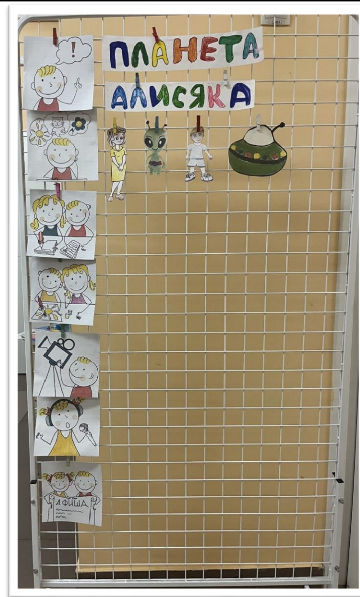
Мультэкран, 2 этап

Для каждой истории героев придумывают сами ребята. Могут нарисовать героев, слепить из пластилина, собрать из конструктора или использовать готовые игрушки (предметы). Нарисованных персонажей помещаем на мультэкран.