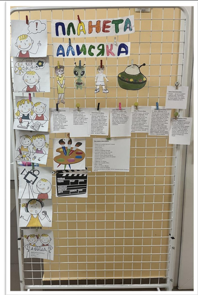
Мультиэкран, 5 этап

Юные мультипликаторы загораются идеей, стараются не пропускать ни одного дня съёмки, в процессе которой учатся брать на себя ответственность при распределении ролей во время съёмки, работать в команде, выдвигать идеи, договариваться, а также наслаждаются своим результатом.