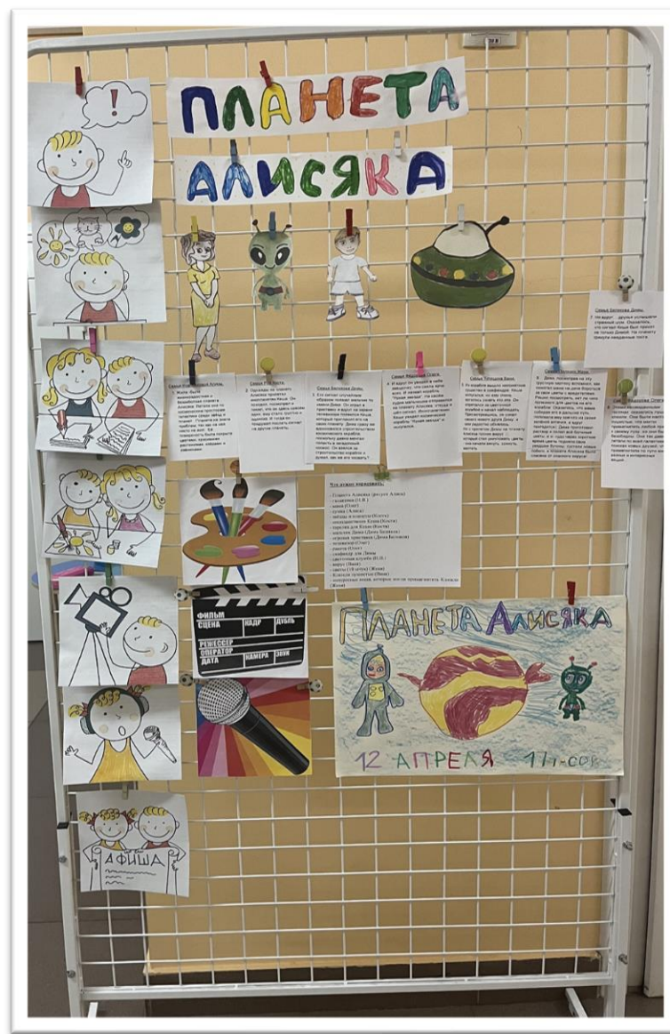
Мультэкран, 7 этап

После того, как воспитатель соберет в программе весь мультфильм (снятую детьми анимацию и записанные голоса героев), ребята рисуют афишу, которая приглашает на премьеру всех желающих, и вывешивают ее на мультэкран.