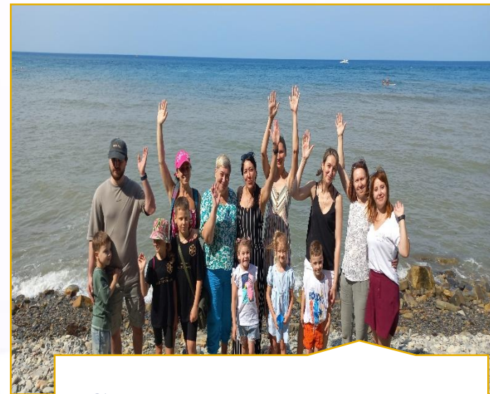
Сенсорная интеграция на берегу моря