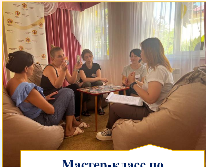
Мастер-класс по применению метафорических карт