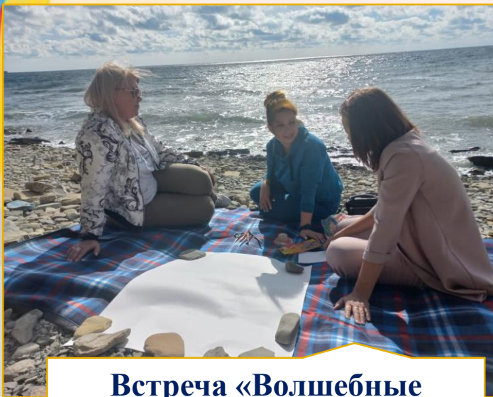
Встреча «Волшебные камешки Черного моря» на берегу моря