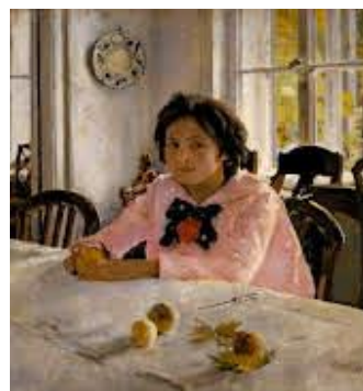
3) В.А. Серов «Девочка с персиками»