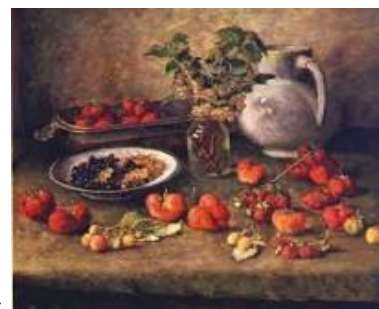
4) И.И. Машков «Клубника и белый кувшин»