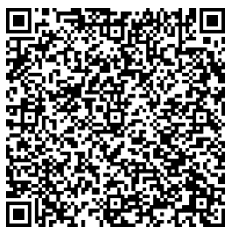
Программа «Терренкур в ДОУ»