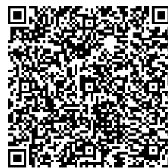
Сборник сценарного материала физкультурных праздников и развлечений для старшего и подготовительного возраста