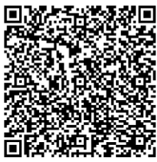
Сборник сценарного материала физкультурных праздников и развлечений для младшего и среднего возраста