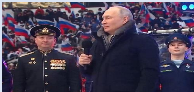
18 февраля –народная акция «Чтобы помнили»