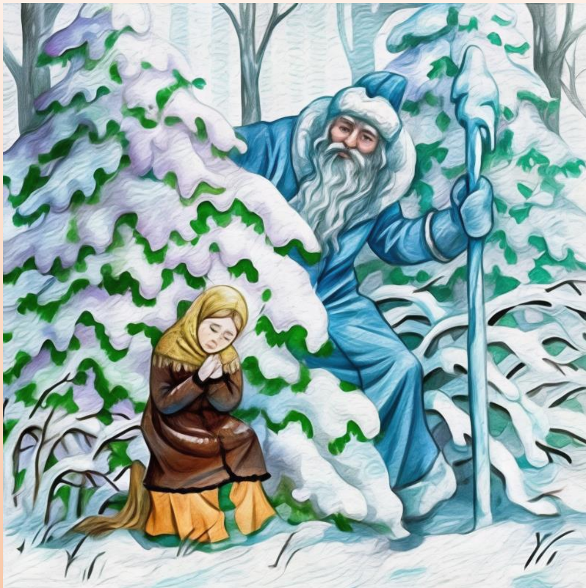
Русская сказка "МОРОЗКО"