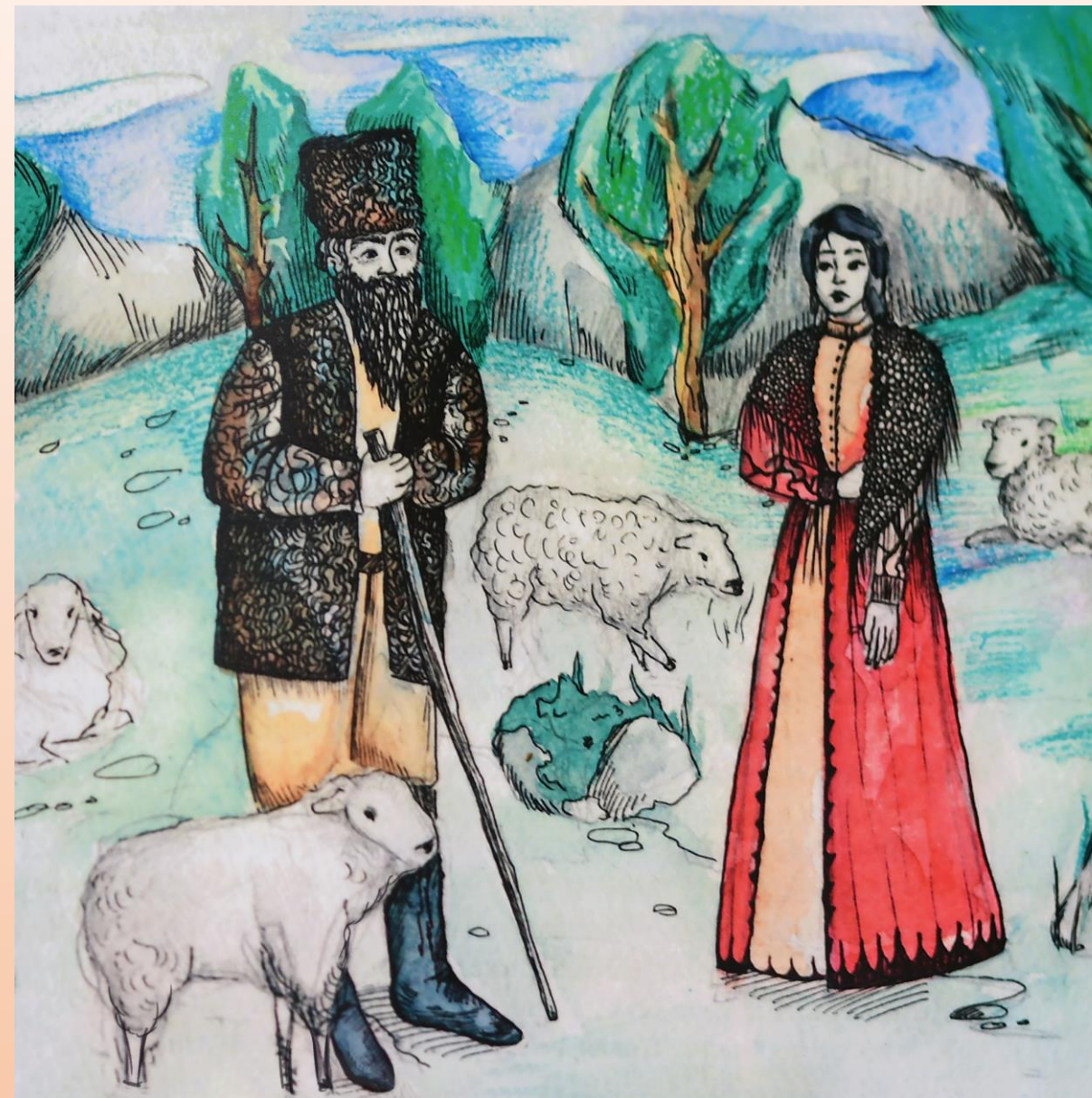
Адыгейская сказка "ДЕВУШКА И ВЕТЕР"

Народные сказки учат детей одним и тем же вечным истинам: доброта, трудолюбие и смирение вознаграждаются, а лень и злость — наказываются.