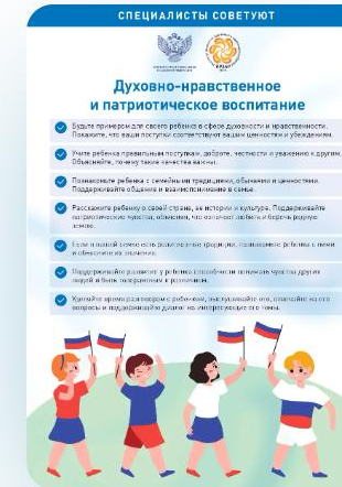
Памятки «Специалисты советуют»