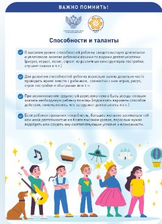
Памятки «Важно помнить»