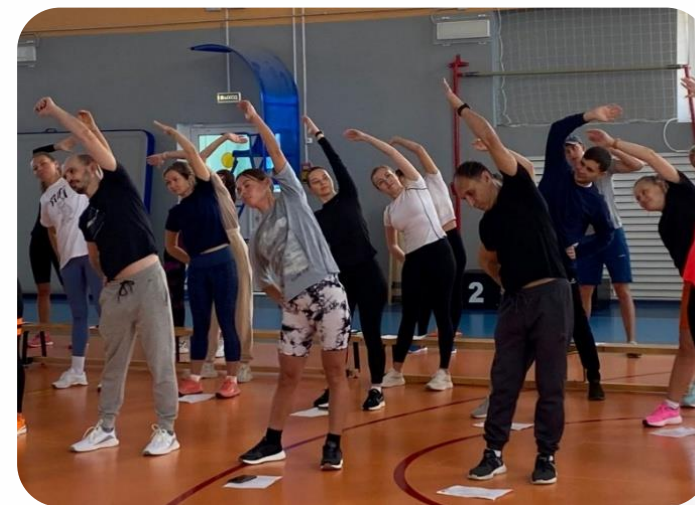
Сдача норм ГТО