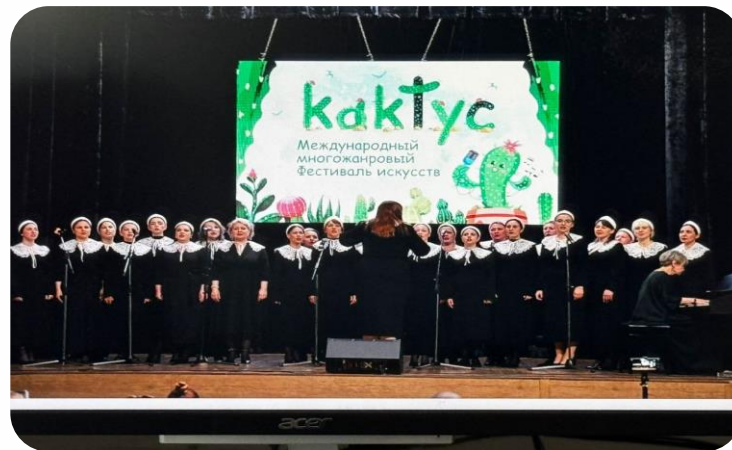
Родительский хор «Душа»

-Лауреат 1 степени международного фестиваля искусств «Кактус»