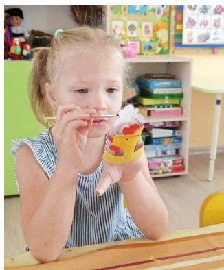
Подготовка костюмов и реквизита