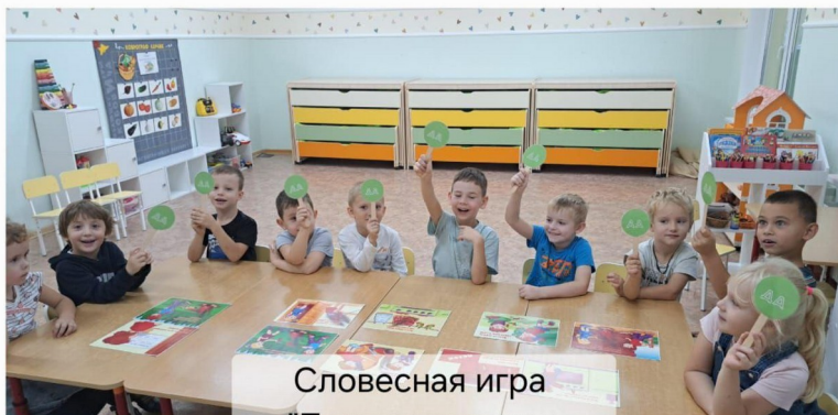
Словесная игра "Пожароопасные предметы"