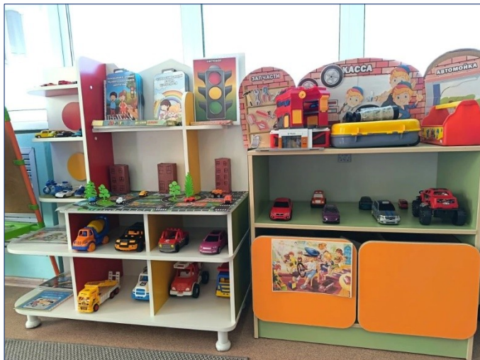
Разметки в зонах