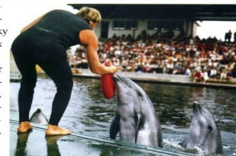
Показательные выступления в дельфинарии

Дельфиний «язык» содержит 110 звуковых выражений. Это своеобразное хрюканье, шипение, свист, жужжание, скрип и т.д. Звуки, издаваемые дельфинами, высокочастотные, и человек может их уловить лишь при замедленной скорости прослушивания звукозаписи.